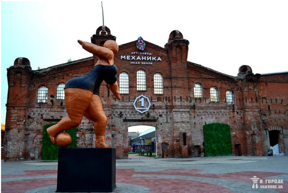
Рис. 1.11. Арт-завод «Механіка» у Харкові

музикантів, скульпторів, дизайнерів, спортсменів. Цьому сприяє заводська атмосфера, індустріальний стиль лофт, таємничі механічні створіння.