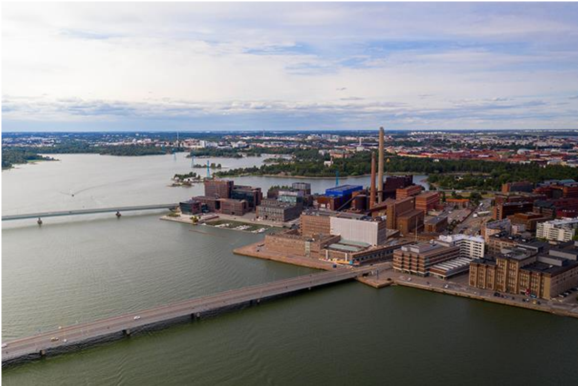
Рис. 1.9. Каарелитехдас

За останні 30–40 років ревіталізація стала досить поширеною в Європі і стала одним з основних напрямків розвитку мегаполісів. Найбільш успішні світові проєкти ревіталізації викладені у табл. 1.5 (Укладено авторами за матеріалами Беляєва Я. [14] та Мехтієв Р. [15]).