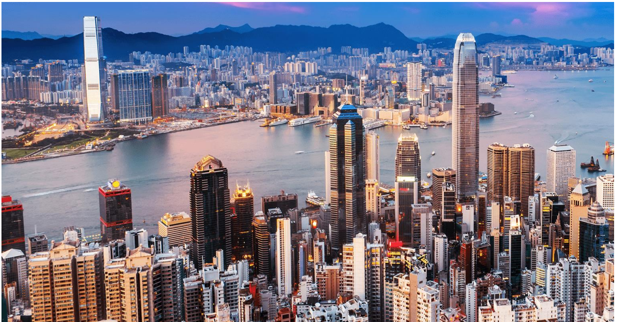
Рис. 1.4. Сучасний Гонконг

Найбільшим вираженням позитивного впливу ревіталізаційних процесів на розвиток території є досвід оновлення Гонконгу, який був промисловим центром Китаю, але наприкінці ХХ століття було вирішено перенести промислові потужності на материковий Китай, тому що це було більш сприятливим для забезпечення необхідних ресурсів для економічного розвитку. Після цього багато колишніх промислових об'єктів Гонконгу залишилися позаду, і питання їх використання стало проблемою. Влада вирішила перетворити занедбані об'єкти на сучасні бізнес-простори та виставкові зали шляхом активної ревіталізації. Таким чином, сучасний Гонконг є одним із найвпливовіших фінансових і ділових центрів у світі та має найбільшу кількість корпоративних штаб-квартир в Азії.