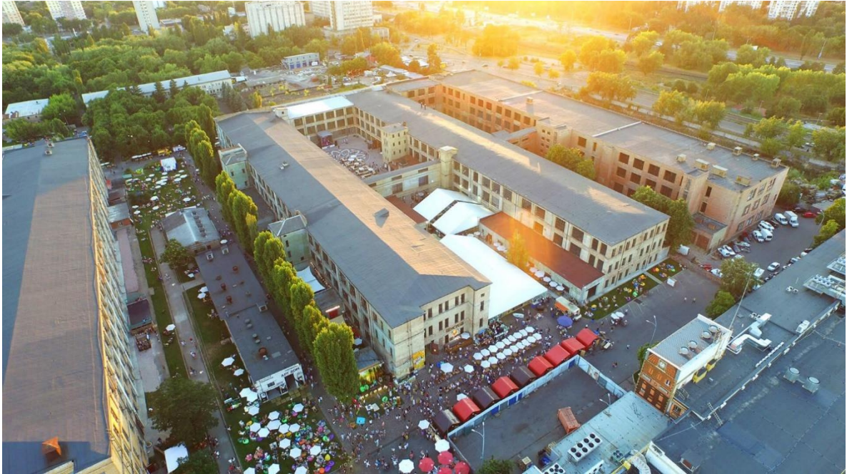
Рис. 1.10. Арт-завод «Платформа» у Києві

зоною столиці. Успіх проекту призвів до дискусії щодо потенціалу та практичності перетворення закинутих промислових зон на сучасні громадські простори та зони відпочинку.