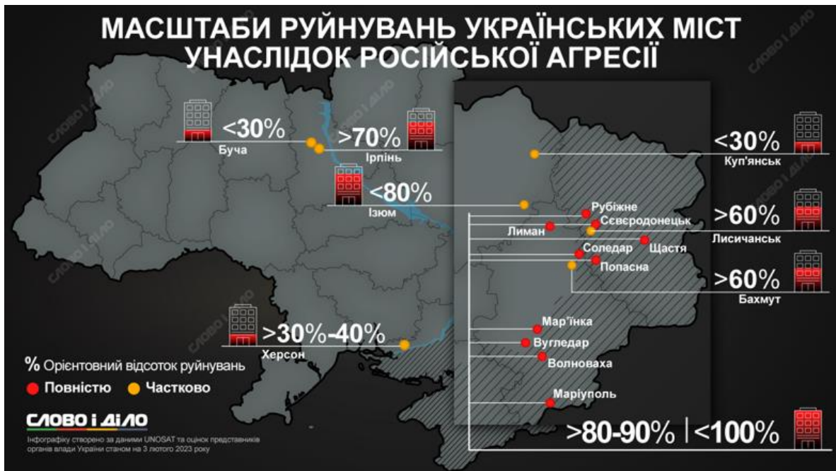
Рис. 2.1. Зруйновані міста України, «Слово і діло»

мир» також знищив кілька українських міст: не залишилося нічого, крім руїн, а кремлівські пропагандисти триумфально проголосили їхнє «визволення». Деякі населені пункти вже не відбудовуватимуть. Нижче наведено інфографіку «Слово і Діло» [43] – які міста повністю чи частково зруйнувала війна.