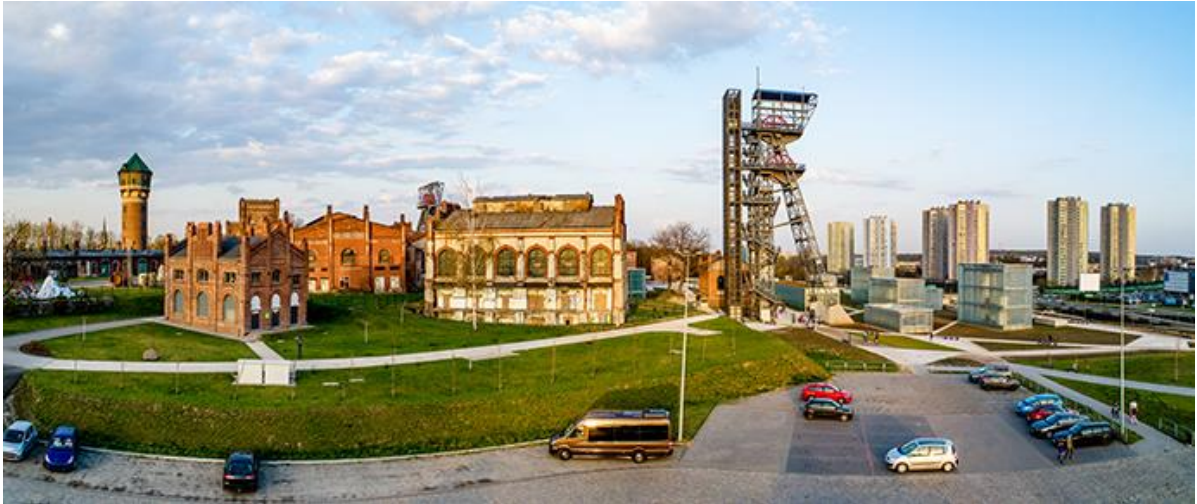
Рис. 1.6. Silesian Museum

Architekten. Вони створили парк над землею та виставкову площу під землею, доповнену спеціально збереженим гірничим обладнанням. Йдеться про ефективніше відображення цих артефактів, а відтак і історії міста.