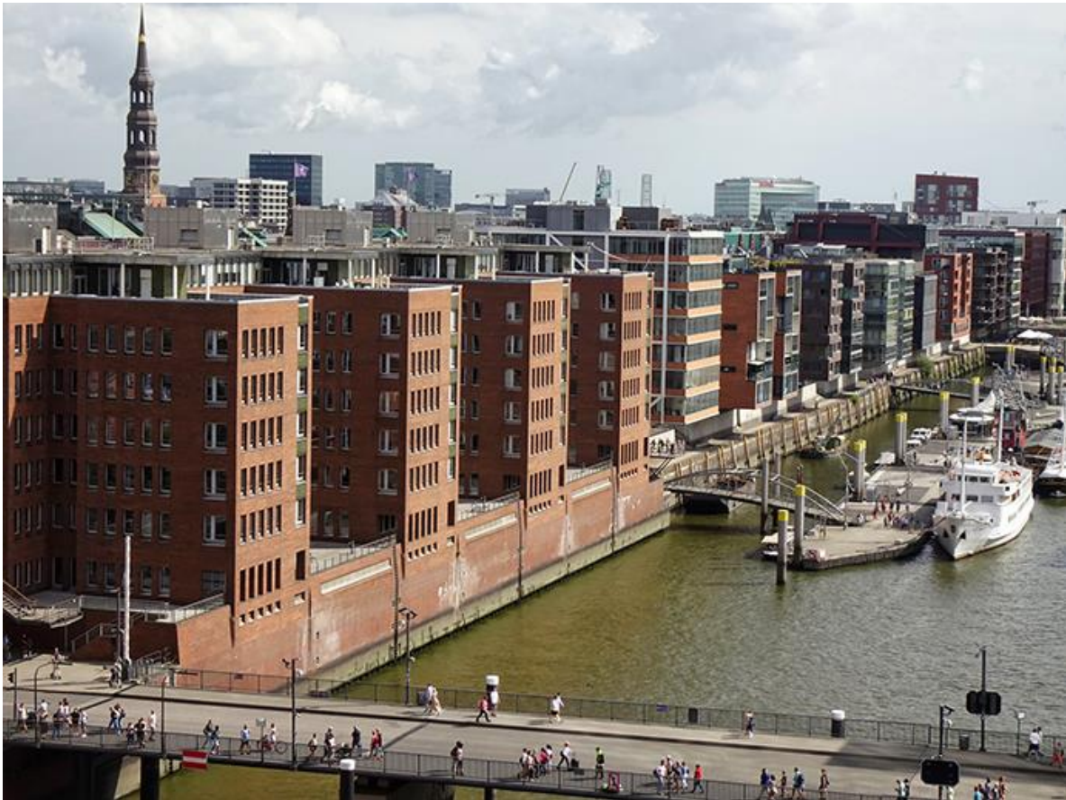
Рис. 1.8. Квартал Хафенсіті в Гамбурзі

Гельсінкі дуже добре знають, як організувати культурні простори. Влада створила кластер, до якого увійшли музеї, магазини, громадські організації та ресторани. Найприємніше те, що для цього не потрібно нічого будувати. У 1939 році в місті з'явився «kaapelitehdas», що в перекладі з фінської – кабельна фабрика [13]. Компанія виробляла кабелі більше 40 років, поки не закрилася наприкінці 1980-х років. На початку 2000-х влада Гельсінкі викупила будівлю і перетворила її на культурний центр. Однак Kaapelitehdas приваблює не тільки своїм культурним змістом. Також це відмінний бізнес, який може щорічно приносити в бюджет мільйони євро, адже тут можна орендувати приміщення для будь-якого заходу.