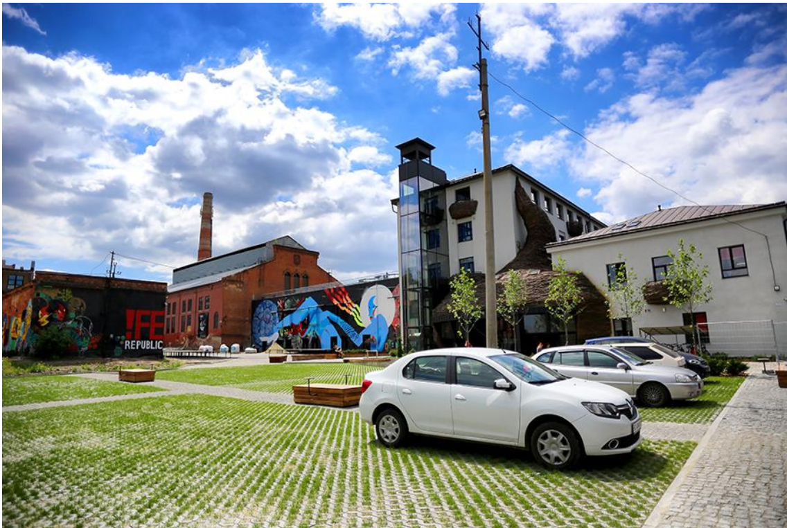
Рис. 1.12. «!FESTREPUBLIC» у Львові

Місто Львів має великий досвід відновлення промислових споруд. Одним із найвідоміших нових місць для бізнесу у Львові є «!FESTrepublic» [37], у цьому закладі є виробничі приміщення та місце для відвідувачів. Його творець – холдинг емоцій «!FEST», створений у 2007 році. Сьогодні «!FESTrepublic» – це простір, який ревіталізує занедбані промислові будівлі та демонструє, що туристичний інтерес Львова не обмежується центральною частиною міста.