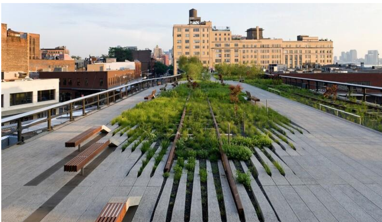
Рис. 1.3. The High Line Park