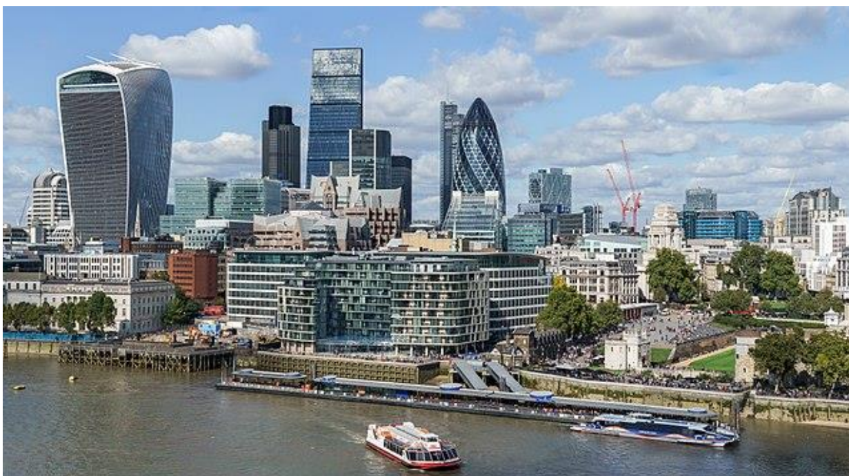
Рис. 1.2. The City of London