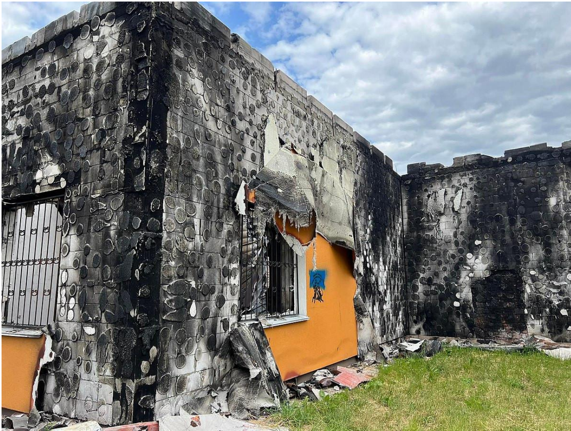
Рис. 2.2. Іванківський історико-краєзнавчий музей

Це було лише початком систематичного знищення культурних пам'яток України російськими окупантами. Вже на початку березня минулого року кількість пошкоджених культурних об'єктів від російської агресії стрімко збільшилася.