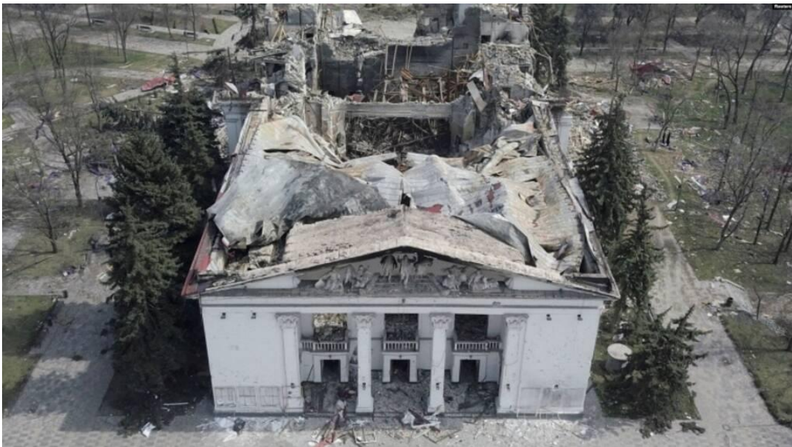
Рис. 2.3 Донецький академічний обласний драматичний театр у Маріуполі, знищений прямим влучанням російської бомби

На другий місяць повномасштабної війни, ЮНЕСКО засвідчувало руйнування 53+ об'єктів культурної спадщини. Але на сьогоднішній день, міжнародна організація ЮНЕСКО документує пошкодження 274 об'єктів, серед яких: 117 релігійних об'єктів; 27 музеїв; 98 будівель історичної та/або мистецької цінності; 19 пам'ятників; 12 бібліотек; 1 архів [137].