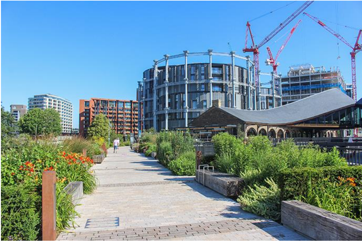
Рис. 1.7. Gasholders London

HafenCity у Гамбурзі можна вважати одним із найамбітніших проєктів регенерації в Європі [12]. Його реалізація почалася в 1997 році і триватиме до 2025 року. Проте вже можна оцінити результати. У 16 столітті Гамбург став комерційним центром Європи з виходом до моря, а порт Хавензіц став центром, що приваблює купців з усього світу. Така ситуація тривала до кінця 20 століття: порт почав втрачати позиції перед технічним прогресом, і люди почали розвивати покинуті склади та майстерні для задоволення власних потреб. Місто вирішило модернізувати територію, зберігши її історичну спадщину. HafenCity тепер є місцем, де люди живуть, відкривають офіси, зустрічаються за кавою або відвідують концерти в красивій будівлі Elbphilharmonie.