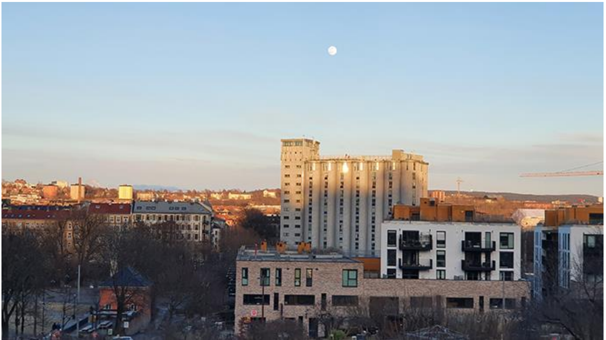
Рис. 1.5. Sio Silo

У дев'яності роки влада Осло вирішувала, що робити з місцевими елеваторами, які вже не працювали. Чиновники думали переобладнати будівлю під житловий будинок. Спочатку там планували побудувати готель, але згодом будівлю перетворили на студентський гуртожиток Sio Silo [9]. Ця величезна будівля, яка спочатку використовувалася для зберігання зерна, була перетворена на 16-поверховий будинок з 226 шикарними квартирами. На перший погляд вони невеликі, але завдяки округлим стінам і світлу з усіх боків кімнати виглядають просторими.