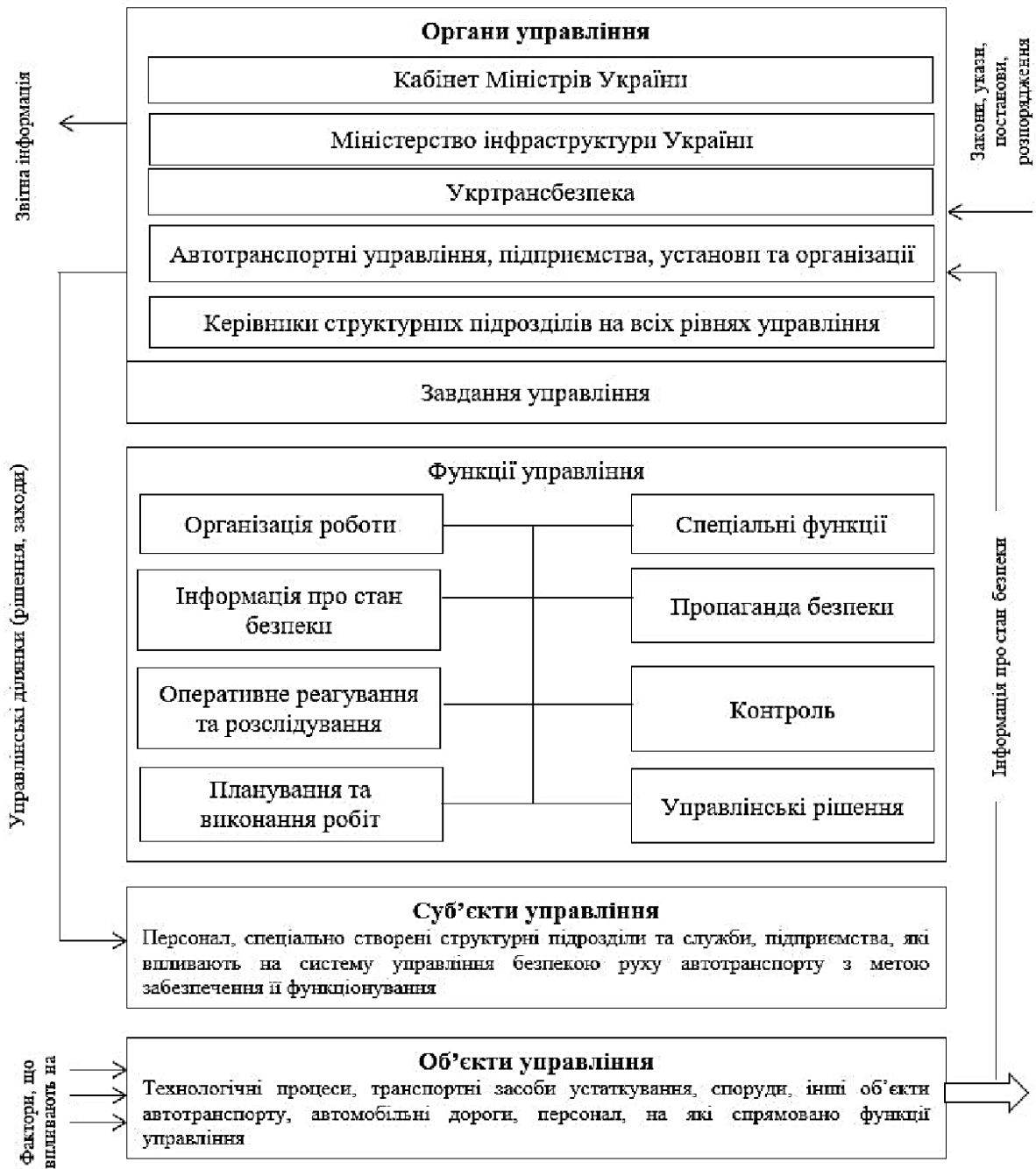
Рис. 1.1. Організаційно-функціональна схема управління безпекою руху на автомобільному транспорті України

До функцій управління безпекою руху автотранспорту належить організація роботи, яка передбачає: