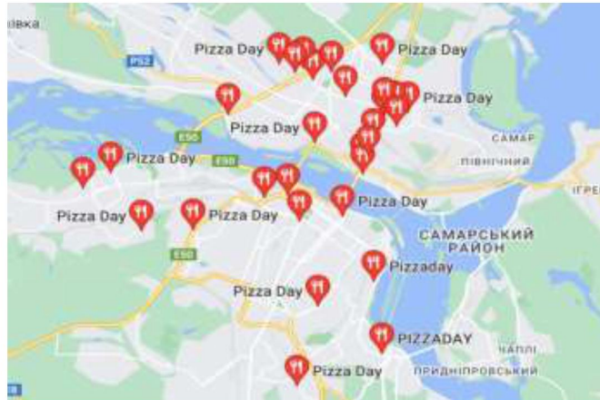
Рис 1.1. Розташування закладів ТОВ «Піца Дей» у м. Дніпро

Франшиза надає підприємству можливість використовувати власну торгову марку, брендovanі рецептури та стандарти обслуговування, що вже визнані на ринку. Основні переваги франшизи включають доступ до відомого бренду, що вже має власну базу клієнтів та добре встановлену репутацію. Крім того, франшиза може надати підтримку у вигляді маркетингової підтримки, рекламних кампаній, статуту з управління та навчання персоналу. Переваги франшизних закладів ТОВ «Піца Дей» відображені у таблиці 1.2: