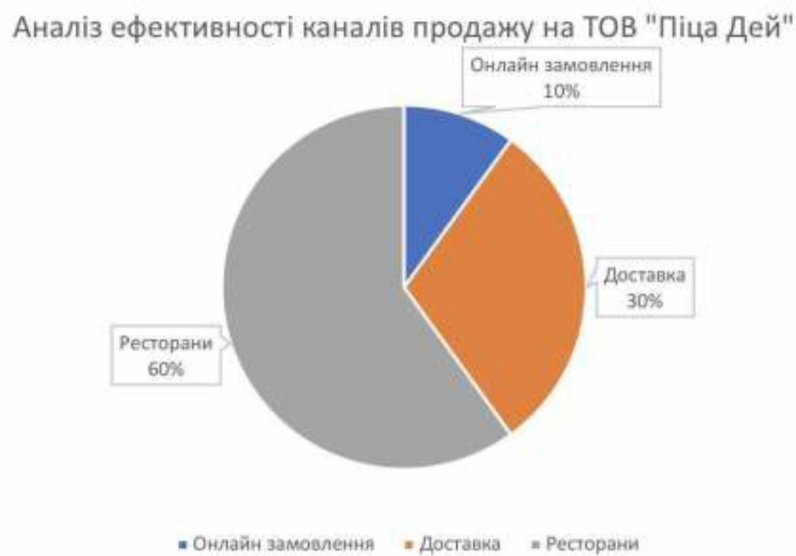
Рис 2.1 Аналіз ефективності каналів продажу на ТОВ «Піца Дей»

Аналітичний облік на ТОВ «Піца Дей» ґрунтується на детальному аналізі окремих складових елементів фінансової діяльності підприємства. Для готової продукції та реалізації, цей метод обліку включає розкриття витрат на сировину, працю та інші виробничі витрати, а також відображення різних видів доходів від реалізації продукції. Аналітичний облік за рахунком 23 «Виробництво» ведеться за видами виробництв, статтями витрат і видами або групами продукції, що виробляється. Один із прикладів аналітичного обліку на ТОВ «Піца Дей» продемонстровано на рисунку 2.1.