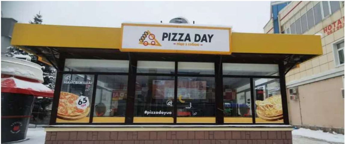
Рис 1.2. Вигляд закладу ТОВ «Піца Дей»

ТОВ «Піца Дей» є ідеальним вибором для насолоди смачною піцою на будь-який смак, бо в закладі представлені, як м'ясні піци так і веганські. Тому кожен може насолодитися головною продукцією цієї мережі. Завдяки своїй сучасній архітектурі, стильному дизайну та зручному розташуванню, «Піца Дей» забезпечує неперевершений досвід для клієнтів. Свіжі та смачні інгредієнти, широкий вибір начинок, напоїв та соусів, а також швидка та зручна доставка роблять «Піца Дей» найкращим вибором для насолоди смаком.