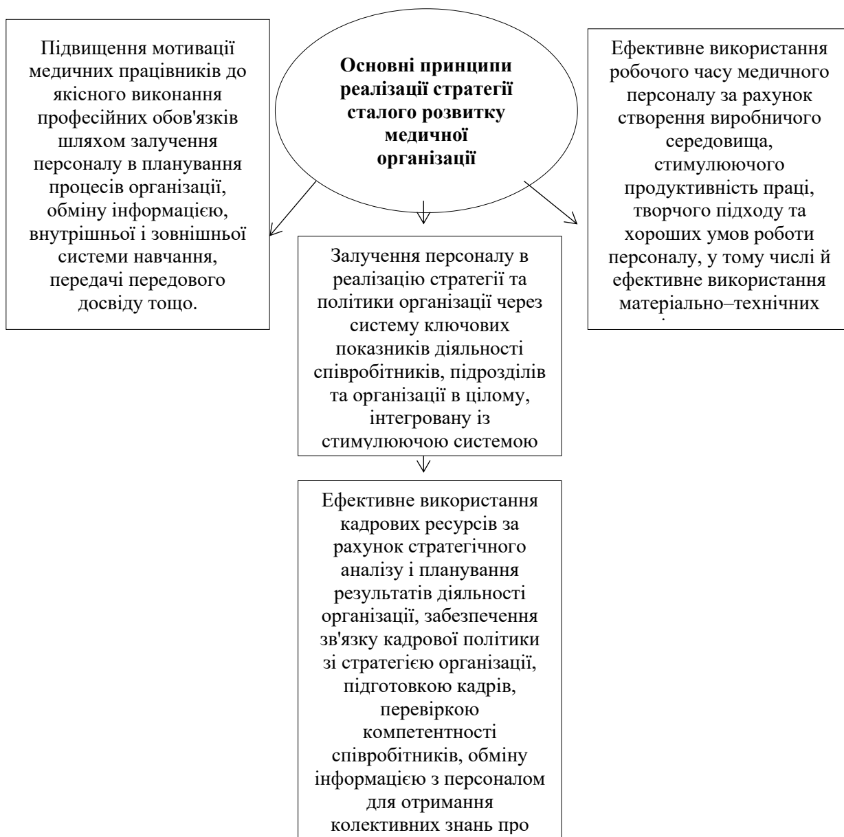
Рис. 3.1. Основні принципи реалізації стратегії сталого розвитку медичної організації

Ефективне функціонування медичних організацій, забезпечення доступності і якості медичної допомоги для населення, можливі при комплексному підході до управління кадровими процесами, що включає не тільки аналіз проблем кадрової забезпеченості, регулювання кадрових процесів, а й впровадження сучасних технологій в медичні організації.