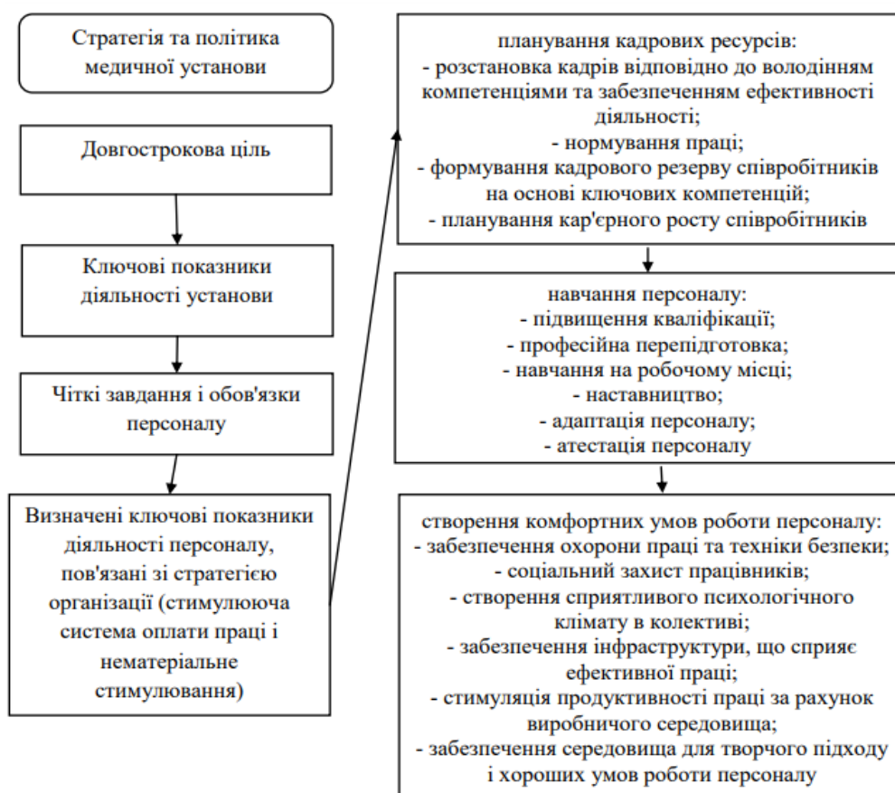
Рис. 3.2. Основні напрямки удосконалення кадрової політики в концепції сталого розвитку медичної організації

Одним із напрямків організаційних інновацій, впроваджених в роботу медичної організації, може стати удосконалення кадрової політики з використанням концепції сталого розвитку медичної організації, деталі якої зображені на Рисунку 3.2.