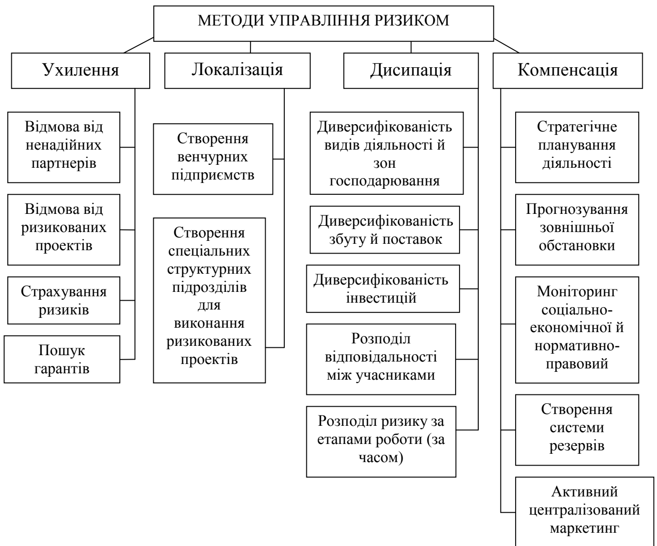
Рис. 1 Методи управління ризиком

Найдієвішим способом ухилення від інноваційних ризиків є їх страхування, що являє собою систему відносин по передачі певних ризиків підприємства страховій компанії (страховикові).