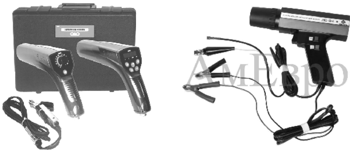
Рис. 3. Электронные стробоскопы

В качестве стробоскопа может использоваться вращающийся диск с секториальной прорезью (рис. 4). Стробоскопический эффект достигается за счет совпадения скорости вращения изучаемого объекта и скорости вращения диска, позволяющего осматривать объект через равные промежутки времени.