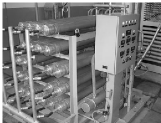
Рис. 3. Общий вид мембранной водородной установки

Значительное преимущество мембранных водородных установок (см. рис. 3) заключается в возможности работы при различных давлениях разделяемого газа. Кроме того, на мембранных установках, в отличие от адсорбционных и криогенных систем, легко осуществляется регулирование чистоты получаемого водорода, что позволяет подобрать для установки наиболее оптимальный режим работы. Водородные установки на основе мембранного разделения не содержат изнашиваемых узлов, по этой причине они практически не требуют обслуживания. Полное отсутствие движущихся деталей в составе установок также является большим достоинством [4]. Благодаря этому стало возможным производить исключительно надежное и неприхотливое в эксплуатации оборудование. При этом установки полностью автоматизированы, обладают отличными техническими характеристиками и очень компактны. Эксплуатировать мембранные водородные установки может персонал без специальной подготовки: поддержка и контроль всех рабочих параметров осуществляется электроникой. Срок службы водородных мембран составляет от 120 до 180 тыс. часов непрерывной работы.