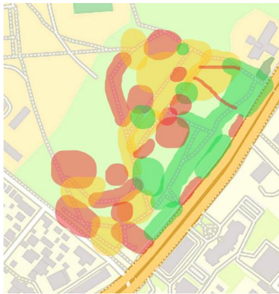
Рис. 2. Схема проблемних ділянок парку

З метою відновлення стану дерево-чагарникових насаджень розроблено та подано на рис. 2 схему основних проблемних ділянок парку, що потребують екологічного та ландшафтного втручання.