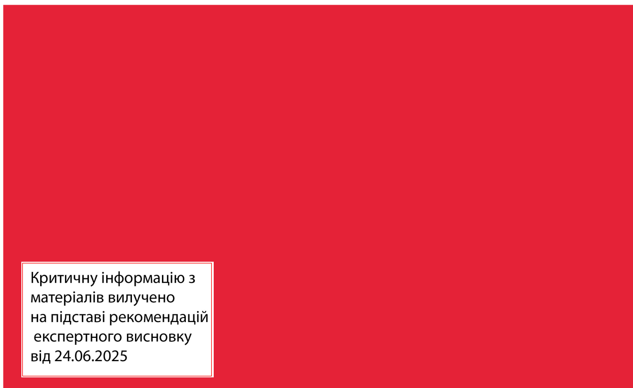
Рисунок 1.5 – Схема розташування та кількості корпусів

Водотоннажні амфібії можна класифікувати за схемою розташування та кількістю корпусів (рисунок 1.5), а також зв'язків між корпусами.