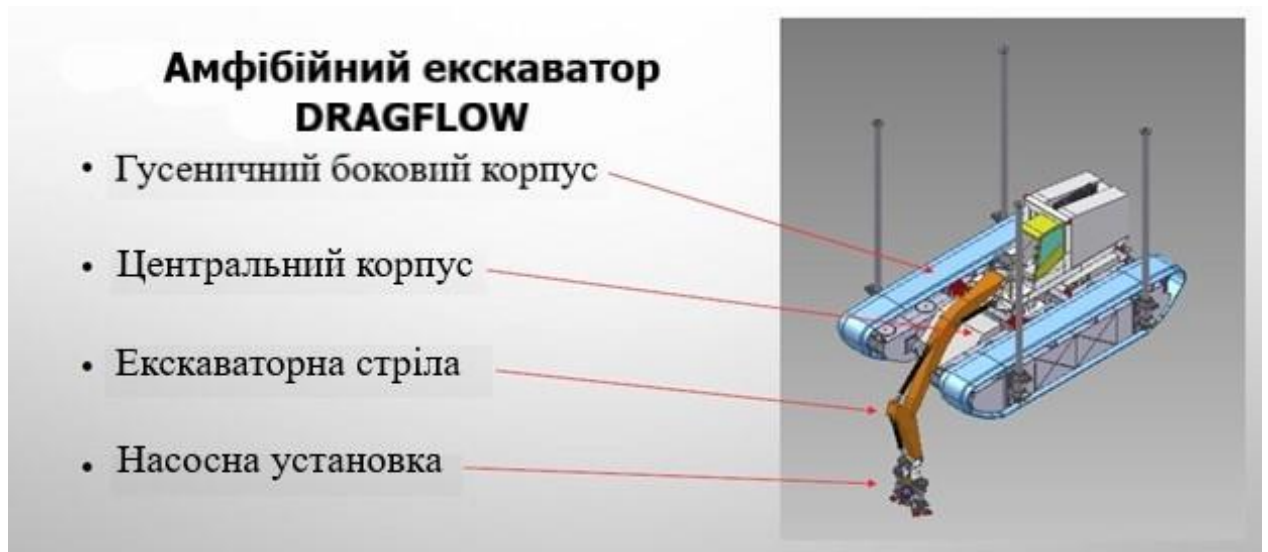
Рисунок 1.2 – Амфібійний екскаватор [5]

• Біоочищення водойм з використанням біопрепаратів - сучасний метод очищення , що дозволяє зробити ефективне очищення водойм (ставки, озера, зрошувальні канали, водосховища, відстійники молокозаводу та ін.) без великих матеріальних витрат. При цьому при використанні біопрепаратів відбувається поступове, спрямоване та контрольоване відновлення біоценозу, що скорочує терміни відновлення порівняно з іншими способами.