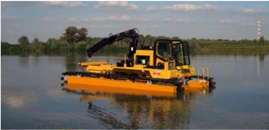
Рисунок 1.1 – Амфібійна грейферна установка [5]