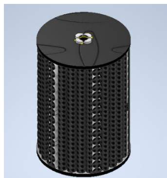
Рисунок 2 – 3D модель оливного фільтру

Для виготовлення фільтру матеріал з якого він робиться повинен відповідати на певні критерії, наприклад: