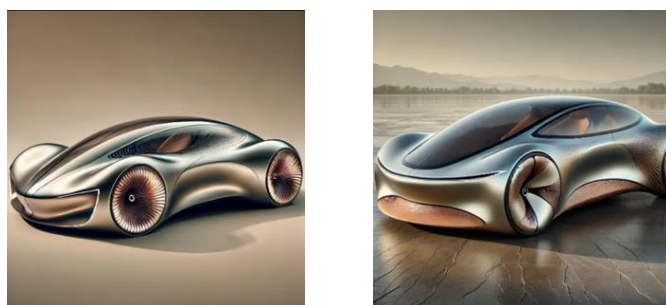
Рисунок 2 – Дизайн автомобіля з плавними контурами

Завдання для ШІ полягало у додаванні природних елементів та створення редизайну наявного ескізу, а саме додати у дизайн елементи морських ракушок тощо. На рисунку 2, за допомогою ШІ отримано проєкт дизайну автомобіля з плавними контурами та деталями панцерів і ракушок, що надають формі авто витонченого та аеродинамічного вигляду. Також у завданні вказано, щоб форма мала найбільш естетичний та гладкий вигляд для автомобіля.