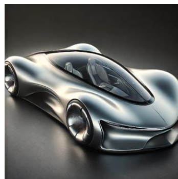
Рисунок 4 – Редизайн автомобіля: стриманий (а), з видимим лобовим склом (б)

Таким чином, у роботі показано, як за допомогою ШІ створено декілька нових видів дизайну автомобіля з використанням природних форм із наявного ескізу виконаного авторами для подальшого створення 3D-моделі. Вже сьогодні використання ШІ допомагає розробляти новий сучасний дизайн автомобілей з урахуванням вимог користувачів, що зможе існувати у реальному світі.