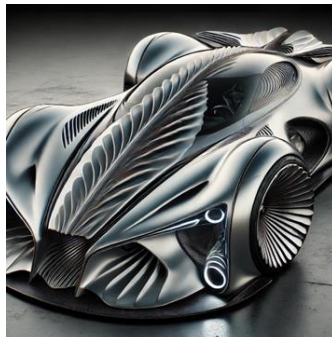
Рисунок 3 – Дизайн автомобіля з більш наявними природними формами

Друге завдання для ШІ полягало у створенні більш яскравого дизайну автомобіля з явними пізнаваними природними елементами. Отримано результат, що відображено на рисунку 3 з гострими кутами, багатьма чіткими лініями, що нагадують форму ракушки, імітують зябра та плавник позаду автомобіля. Цей варіант має найбільшу кількість пізнаваних елементів з морських біонічних форм.