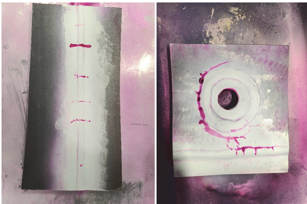
Рис.1. – Індикація дефектів за допомогою капілярного контролю (РТ)

Цифрова радіографія (RT) системою GO-SCAN забезпечила візуалізацію внутрішньої структури, дозволила виявити ознаки непроварів та внутрішніх пор, які були недоступні для поверхневих методів (Рис. 2).