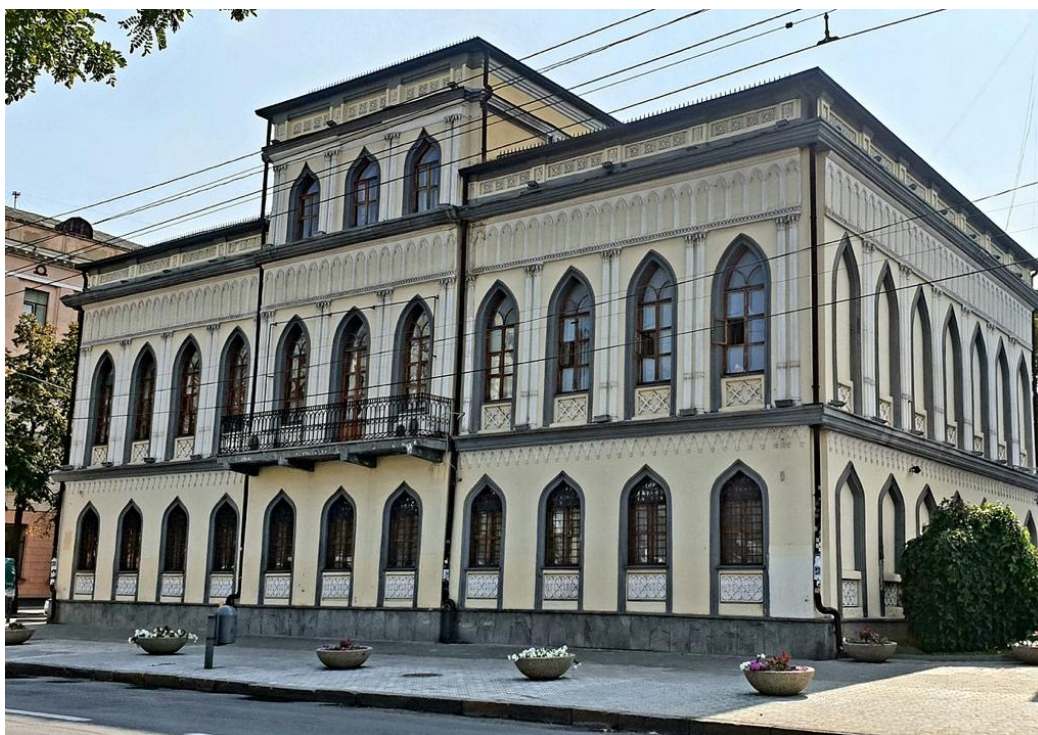
Рисунок 1.1 – Фасад КП «Музей історії Дніпра» (зовнішній вигляд будівлі)

можливості для онлайн-освіти, віртуальних екскурсій і залучення аудиторії за межами Дніпра. Значну роль у формуванні експозиції відіграють мешканці міста. Музей активно займається збором усної історії, приймає у дар предмети, фотографії, документи, пов'язані з життям містян. Таким чином, він стає «музеєм для громади» – платформою, де історію створюють самі люди, розповідаючи свої історії. Фондова колекція нараховує понад 12 тисяч одиниць збереження, які постійно поповнюються. У музеї зберігаються рідкісні артефакти: від стародруків і археологічних знахідок до промислових зразків, фотографій, меморіальних речей. Частина експонатів представлена в цифровому форматі, що відповідає сучасним тенденціям цифровізації культурної спадщини. Кадровий потенціал музею становлять висококваліфіковані фахівці – історики, культурологи, музейники, PR-фахівці, екскурсоводи. Постійне підвищення кваліфікації, участь у міжнародних конференціях, грантових програмах, обмінах досвідом дозволяє підтримувати високий рівень професійності та впроваджувати інновації. Зовнішній вигляд КП «Музей історії Дніпра» наведено на рис. 1.1: