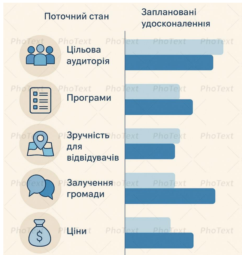
Рисунок 2.2 – Порівняння поточного стану та запланованих удосконалень екскурсійної діяльності КП «Музей історії Дніпра» за ключовими напрямками Джерело[11]

На рисунку 2.2 наведено порівняння поточних та запланованих заходів КП «Музей історії Дніпра», яке відображає контраст між поточним станом і бажаним рівнем розвитку за кожним із напрямів: