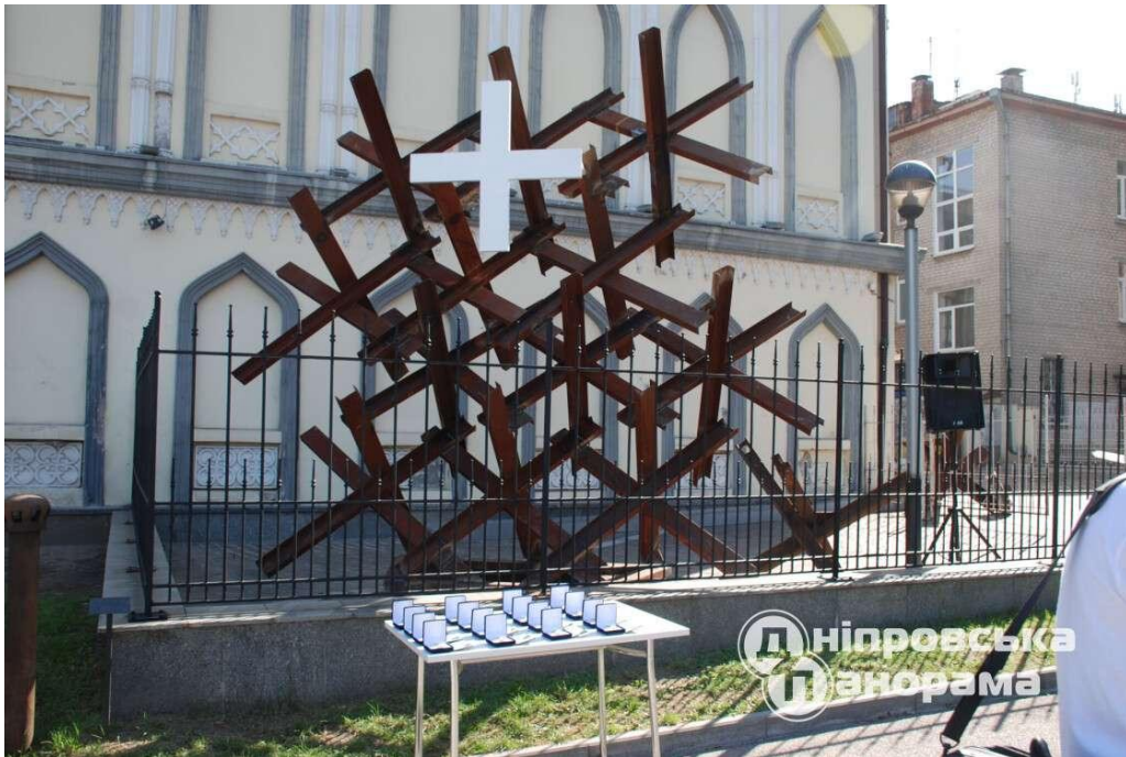
Рисунок 2.5 – Інсталяція «Хрест ЗСУ», м. Дніпро

– пам'ять захисників України (рис. 2.5).