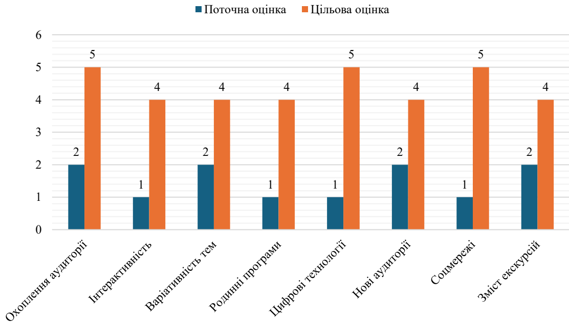
Рисунок 2.1 – Порівняльна діаграма поточного стану та цільового рівня розвитку екскурсійної діяльності КП «Музей історії Дніпра»

Дані таблиці 2.2 свідчать про те, що середній рівень розвитку напрямів становить 1,5 бали. Це демонструє потребу в комплексному реформуванні екскурсійної діяльності. Для наочного порівняння поточного та бажаного стану створено діаграму (рис. 2.1), яка ілюструє відставання за ключовими напрямами: