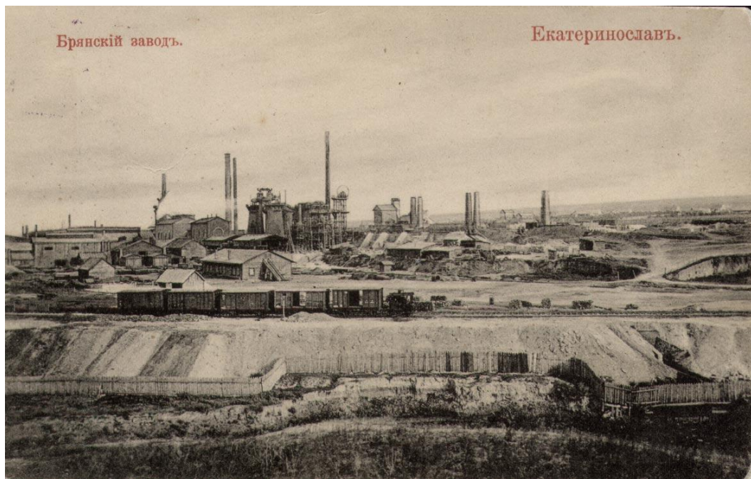
Рисунок 2.4 – Брянський завод у 1887 році (нинішня назва – Дніпровський металургійний завод)