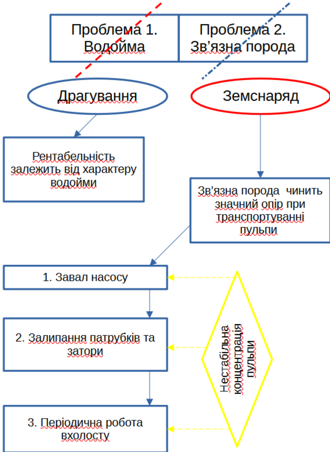
Рисунок 1.1 Блок-схема специфіки роботи при підводному видобуванні зв'язних водонасичених осадових порід