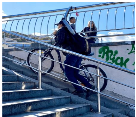
Рисунок 1.3 – Приклади впровадження ініціатив у сфері безбар'єрного простору міста Самар