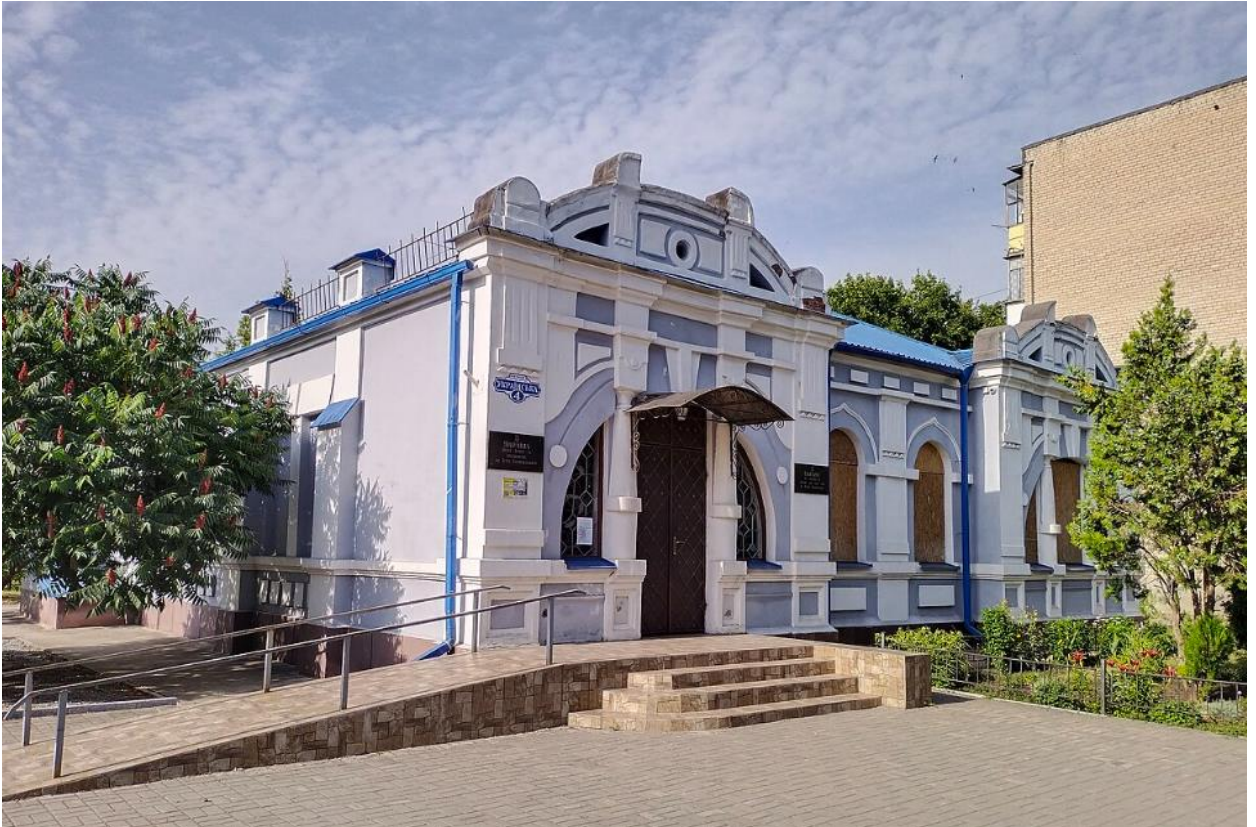
Рисунок 2.1 – Приклад елементів безбар'єрності у Самарівському історико-краєзнавчому музеї ім. П. Калнишевського