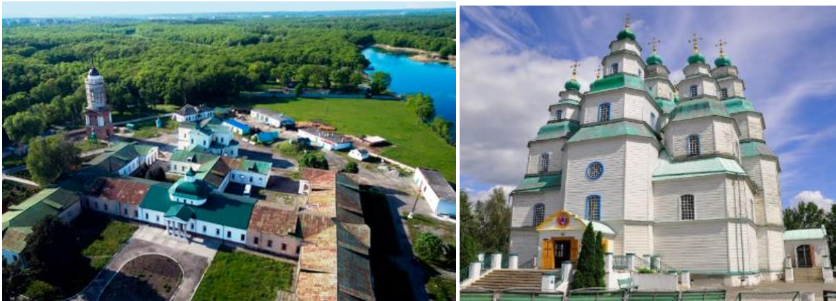
Рисунок 1.1 – Культурні пам'ятки національного значення в місті Самар (Пустельно-Миколаївський Самарський монастир, Свято-Троїцький собор)

2. Дзвіниця Свято-Троїцького собору – архітектурна пам'ятка ХІХ століття (охоронний номер 1082), також знаходиться на площі Перемоги, охороняється відповідно до розпорядження від 12 квітня 1996 року №158-р.