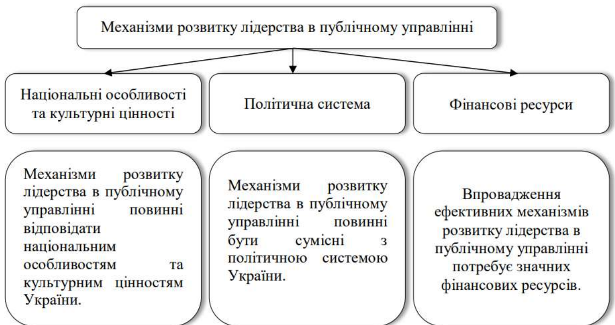
Рис. 3.2 Механізми розвитку лідерства в публічному управлінні [37]

Важливою є також підтримка з боку вищих ешелонів влади та органів державної влади. Без такої підтримки буде важко створити ефективні механізми розвитку лідерства в державному управлінні.[38]