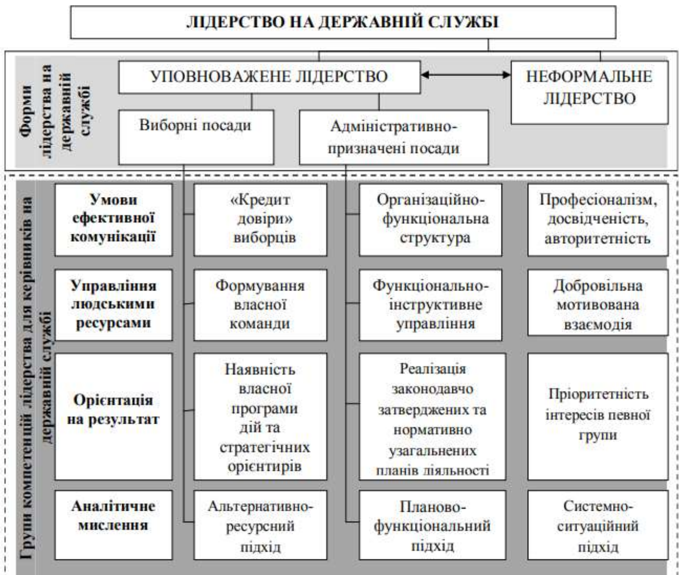
Рис. 1.1. Лідерство та компетенції лідера на державній службі

приймати ризиковані рішення, здатність до наполегливості в умовах невизначеності, схильність вести за собою інших, інтелект, творче мислення, активність, впевненість у собі, почуття власної гідності), а також здатністю йти на ризик, наполегливість, далекоглядність, переконливість, прагнення до успіху, комунікабельність та лідерські якості (формальний авторитет, аналітичні здібності, досвід, високий рівень загальної культури, розуміння меж дозволеного, постійний пошук нових знань), саме цей синтез відрізняє лідера від інших лідерів і визначає його основну функцію – перетворення групи на згуртовану монолітну команду, формування цієї команди та позитивний особистий вплив на вирішення спільних проблем.