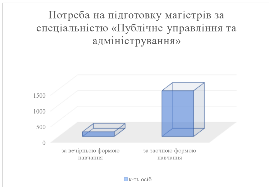
Рис.2.1. Загальні потреби на підготовку магістрів за спеціальністю «Публічне управління та адміністрування» (побудовано на основі [1])

Станом на 31.12.2022 р. чисельність державних службовців в Україні становила 242028 осіб, у тому числі за категоріями посад: «А» - 587 осіб, «Б» - 63656 осіб, «В» - 177785 осіб [22]. У 2023 році кількість посад категорії «А» становила 1675. Національна державна служба визначає потребу в магістрах публічного управління та адміністрування, які готуються навчальними закладами на основі ступеня бакалавра, що відповідає 150 особам для вечірньої форми навчання та 1450 особам для заочної форми навчання (рис. 2.1).