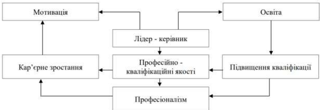
Рис. 3.1. Модель розвитку лідерства в публічно-управлінській діяльності [36]

Розвиток лідерства в державному управлінні - це комплекс заходів, спрямованих на підвищення професіоналізму та навичок лідерів державного управління. Водночас, розвиток складна система, яка може бути зображена наступним чином (рис. 3.1)