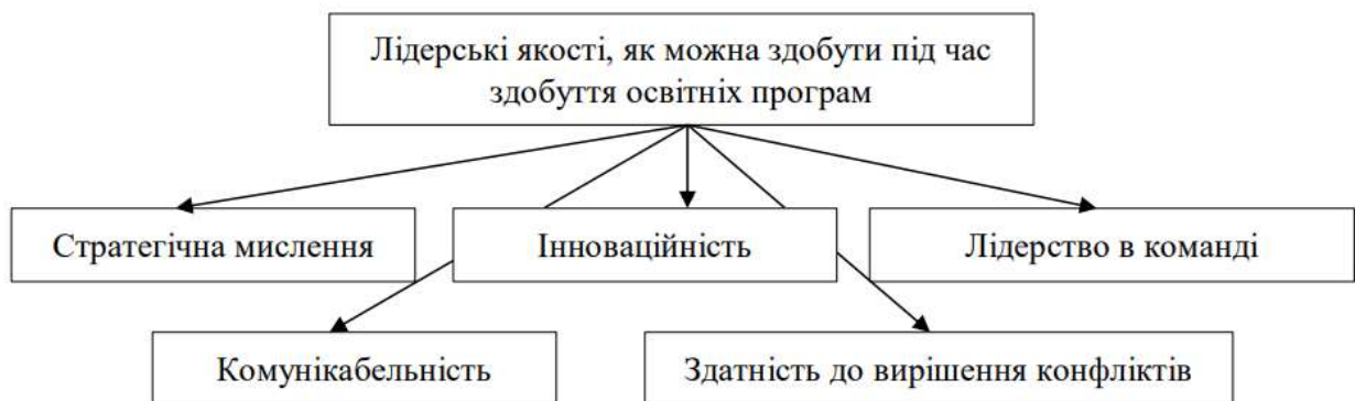
Рис. 3.3. Лідерські якості, які можна здобути під час здобуття освітніх програм [38]

Створити систему навчання та професійного розвитку державних службовців, спрямовану на розвиток лідерських навичок, яка має включати широкий спектр навчальних програм, стажувань та інших заходів. Ці програми мають бути розроблені з урахуванням національних особливостей та культурних цінностей України, а також її політичної системи. Освітні програми повинні бути спрямовані на розвиток таких лідерських компетенцій (рис. 3.3).