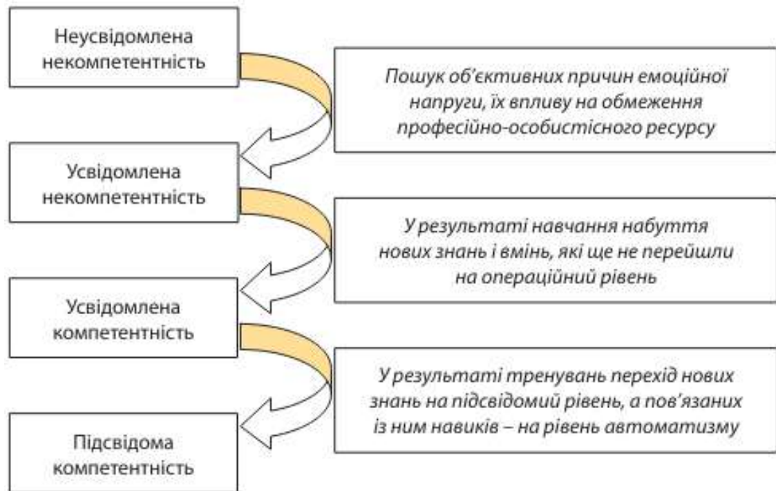
Рис. 2.3. Цикл формування (розвитку) лідерських якостей [25]

– відпрацьовує теорію і закріплює необхідні навички. Необхідність у формуванні або розвитку лідерських якостей керівника найчастіше виявляється безпосередньо у процесі його діяльності, та здійснюється за моделлю, поданою на рис. 2.3.