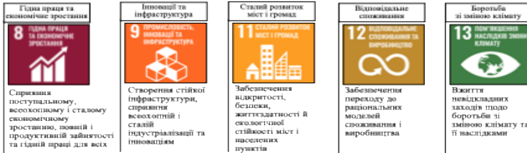
Рисунок 2 – Пріоритетні напрями металургійних підприємств у сфері сталого розвитку [2]

«Електрометалургійний завод «Дніпроспецсталь» ім. Кузьміна» та ПАТ «Дніпровський металургійний завод» може бути рекомендовано розробити стратегію забезпечення сталого розвитку, яка враховує особливості їх діяльності. Тож, на рисунку 2 наведені Цілі сталого розвитку, яких дотримуються лідери галузі [2].