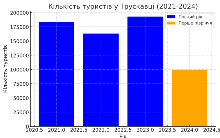
Рисунок 2 – Загальна динаміка туристів (2021-2024)

У 2021 році місто відвідало 183 444 туристи, у 2022 році – 163 218, а в 2023 році – 193 032. За перше півріччя 2024 року Трускавець прийняв 99 639 відпочивальників, причому більше усього в літній сезон, який традиційно є найактивнішим. Ці дані свідчать про поступове відновлення та зростання туристичного потоку до Трускавця, що підкреслює його значення як важливого бальнеологічного курорту (Рис.2).