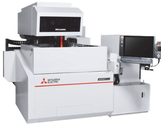
Рис.2. – Електроерозійний верстат MITSUBISHI MV2400S NewGen [9]

такими як Inconel 718. Завдяки використанню технології цифрового управління з компенсацією температури, досягається стабільна обробка навіть при довготривалих вирізах.