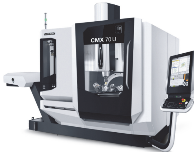
Рис.3. – Верстат з програмним керуванням DMG Mori CMX70U [10]

Програмні операції механічної обробки виконуються на п'ятикоординатному верстаті з ЧПК DMG Mori CMX70U (рис. 3). Верстат має магазин на 30 інструментальних позицій і поворотну інструментальну головку, що дозволяє виконувати обробку деталі з однієї установки.