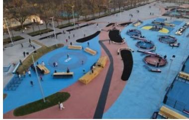
Рисунок 3 – Формування громадського простору