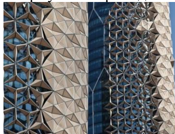
Рисунок 4 – Конструктивні інновації