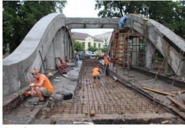
Рисунок 2 – будівництво мостів за зразком минулого