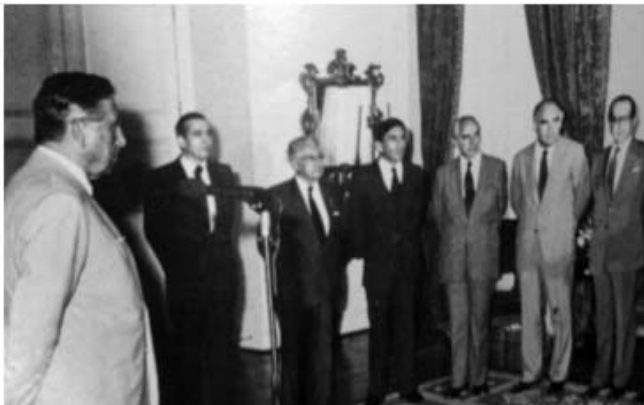
FIGURE 2.1 Augusto Pinochet (left) at a ceremony at the Institute of Political Science, University of Chile in 1983

відображенням навколишнього капіталістичного світу. Маскуючи свої схильності та уподобання професіоналізмом та науковою об'єктивністю, вони стають аполітичними та консервативними» (Chilcote 2018). Сказане стосується не тільки демократій, Наприклад, на фото нижче ми бачимо відомого диктатора Августо Піночета, який своєю присутністю легітимізує існування та функціонування чилійської Асоціації політичної науки. Дослідивши розвиток політичної науки в Латинській Америці, Пауло Ревекка каже про існування «авторитарної політології», яка характеризувалася академічним просуванням інституційної та політичної спадщини диктатури. Зокрема, більшість політологів Чилі обґрунтовували обмежену форму демократії, захищали неолібералізм як єдиний підхід, що гарантує свободу, а також проголошували себе хранителями Заходу і християнства (Ravessa 2019).