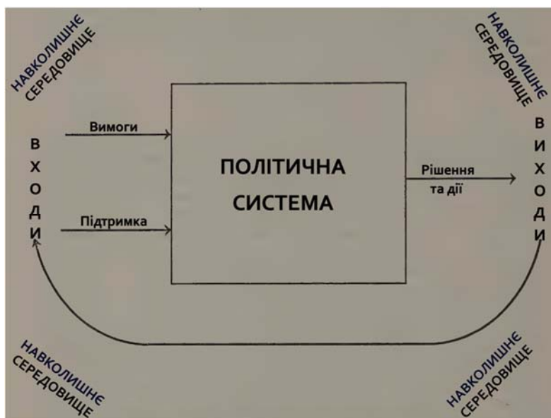
Мал. 1. Спрощена модель політичної системи

Так ми підібралися до визначення політичної системи Девіда Істона, що нині є класичним: «Я стверджував, що для максимальної корисності політична система може бути позначена як всі ті взаємодії, за допомогою яких у суспільстві авторитетно ( authoritatively ) розподіляються цінності» (Easton 1965b). Термін « authoritatively » складно адекватно та однозначно перекласти засобами української мови, адже в англійській він передбачає наявність авторитету, влади, поваги, покори та в цілому є похідним від « authority », що зазвичай означає орган (влади). Візуально, політична система виглядає так (Девід Істон милосердно назвав цю модель спрощеною):