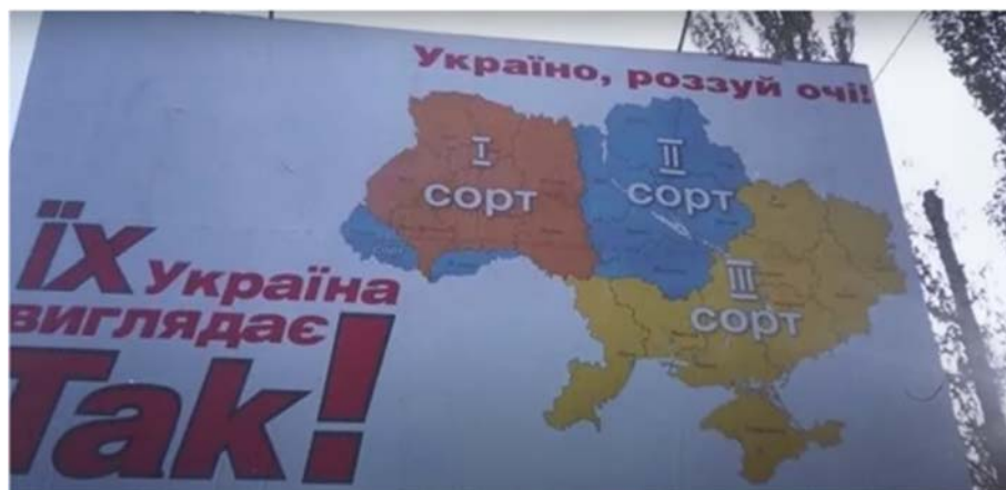
Мал. 4. Біл-борд виборчої кампанії Віктора Януковича у 2004 році

Віктор Ющенко ділить українців на три сорти: найкращих та справжніх, що мешкають на Заході, менш вартісних, що проживають в центральних регіонах, та українців найнижчого, третього сорту – вихідців з південно-східних країв.