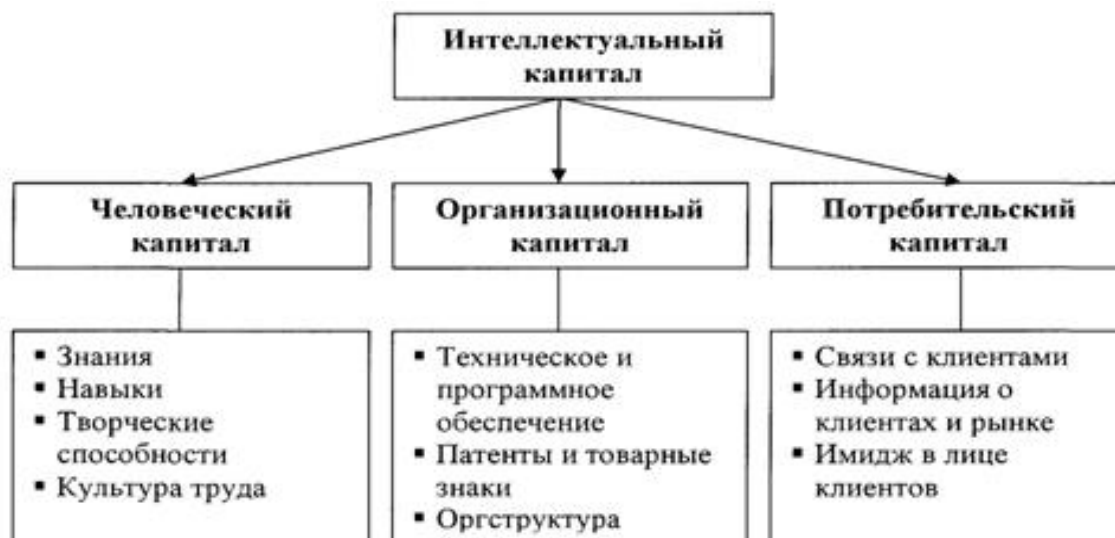
Рис.1. Структура интеллектуального капитала предприятия

В доиндустриальном обществе приоритет принадлежал природным и трудовым ресурсам, в индустриальном - материальным, в постиндустриальном - интеллектуальным и информационным ресурсам. В настоящее время технологическая революция с информационными технологиями в центре заново формирует материальную основу общества. В подобных условиях в рамках экономической категории «капитал предприятия» все более весомую часть начинает занимать такая его составляющая как «интеллектуальный капитал». Интеллектуальный капитал определяют как знания, навыки, производственный опыт конкретных людей и нематериальные активы, включающие патенты, базы данных, программное обеспечение, товарные знаки и другие, продуктивно используются в целях максимизации прибыли и других экономических и технических результатов.