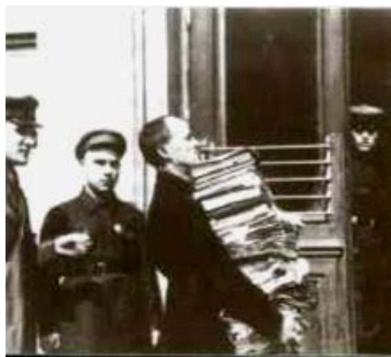
Материалы Шахтинского дела

Среди обвиняемых большинство (35 человек) были горными инженерами, окончившими, в основном до революции Екатеринбургский и Петербургский горные институты, имевшие большой опыт работы на шахтах Донбасса. В число обвиняемых попали также горные техники, электротехники, механики.