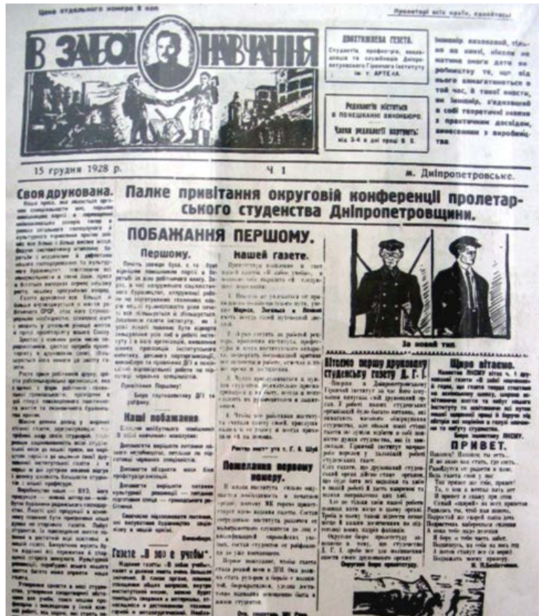
1-й номер газеты ДГИ «В заборі навчання» от 15 декабря 1928 г. также писал об актуальных вопросах, поднятых «шахтинским процессом»: карикатура – «За новый тип» (специалиста); главные лозунги на страницах газеты: подготовка красных специалистов, культурная революция, строительство социализма в стране

В 1928 г. огромное большинство специалистов на предприятиях и в госучреждениях все еще состояло из представителей дореволюционной интеллигенции. И лишь 2 % из них были членами партии. Смысл «шахтинского дела», организованного как раз накануне принятия пятилетнего плана, становился совершенно ясным: скептицизм и безразличие по отношению к великому делу, предпринятому партией, неизбежно ведут к саботажу. На протяжении 1928-1929 гг. тысячи сотрудников ВСНХ, ЦСУ, Госплана, Народного комиссариата земледелия, Народного комиссариата финансов были отстранены от выполнения служебных обязанностей.