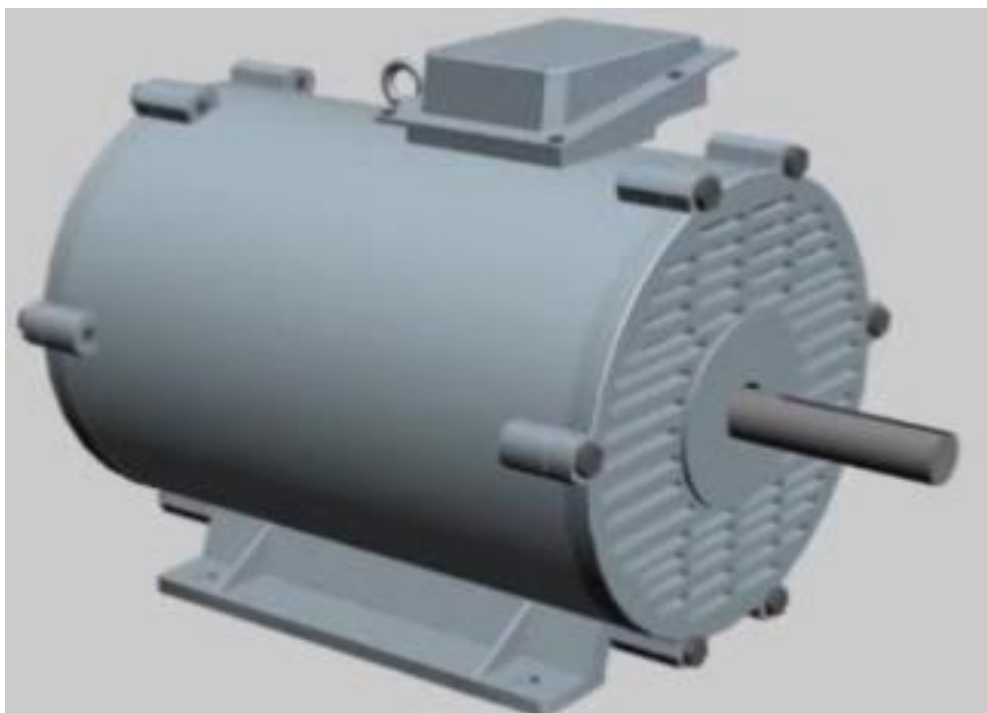
Рис. 10. Тривимірна модель машини постійного струму в середовищі 3D Studio MAX

При моделюванні корпусу і його компонентів були застосовані стандартний примітив циліндр (Cylinder) і модифікатор Edit Poly з основними булевими операціями. У результаті з усіх вище змодельованих підоб'єктів була сформована тривимірна модель машини постійного струму (рис. 2), що надалі може бути піддана різним видам анімаційної візуалізації.