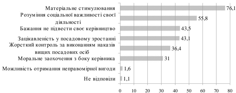
Рис. 2. Найважливіші стимули якісного виконання посадових обов'язків

Найдієвішим стимулом якісного виконання посадових обов'язків для сучасних службовців залишається матеріальне стимулювання – цей стимул назвали 76,1 % працівників органів влади. Однак поряд із цим для 55,8 % службовців важливим стимулом є розуміння соціальної важливості своєї діяльності. Третім за популярністю стимулом є бажання не підвести своє керівництво (43,5 %), а четвертим – зацікавленість у посадовому зростанні (43,1 %). При цьому майже кожний третій респондент називав такий стимул, як жорсткий контроль за виконанням наказів вищих посадових осіб (36,4 %). Водночас моральне заохочення з боку керівника є важливим стимулом для 31 % сучасних службовців. Найменше працівників органів влади на сучасному етапі розвитку публічної служби цікавить можливість отримання неправомірної вигоди, про яку говорили лише 1,6 % опитаних.