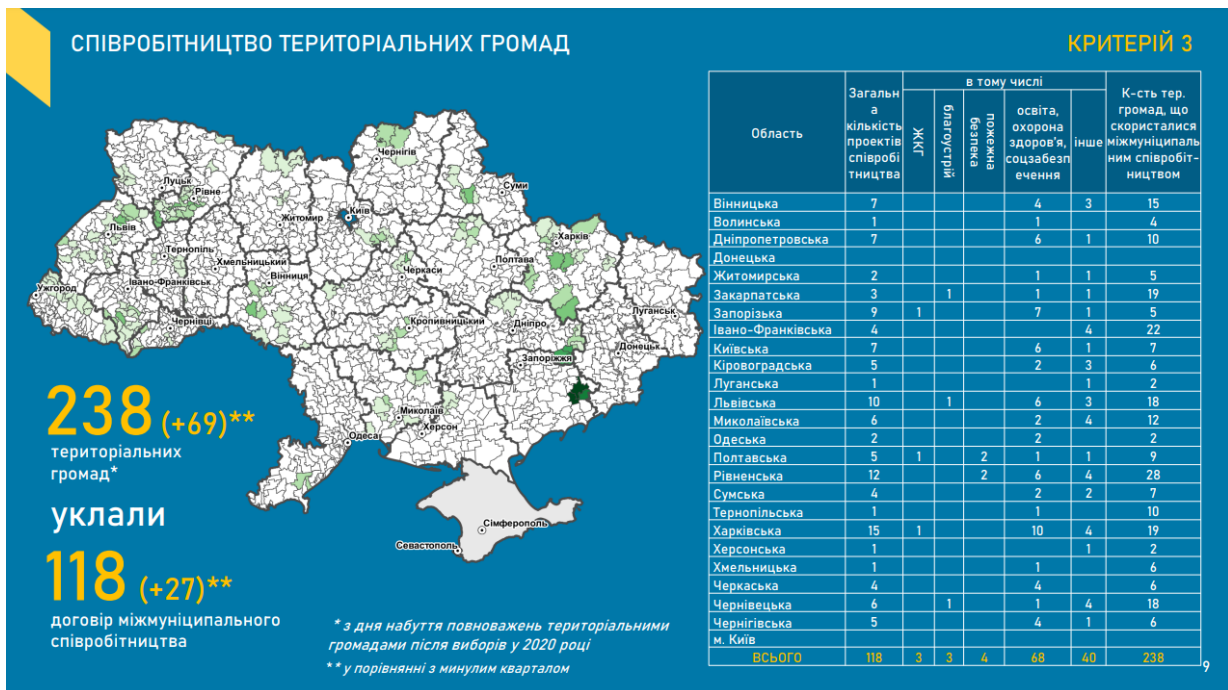
Рис. 2. Інформація щодо стану міжмуніципального співробітництва в Україні станом на 07 жовтня 2021 року [5]

– визначення на державному рівні об’єктів, створення або реконструкція яких можливі лише на умовах співробітництва. Такий підхід сприятиме зменшенню розпорощення коштів місцевих бюджетів і їх ефективнішому використанню;