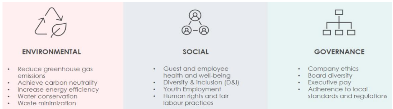
Рисунок 2 - Ключові показники ESG в гостинності

Отже, закладам гостинності потрібно здійснювати стратегічне планування сталого розвитку, що включає визначення кількох сфер, на які потрібно звернути увагу; розробка планів дій для кожної сфери з практичними кроками та часовими рамками. Тобто створена стратегія та план сталого розвитку мають фіксувати та пояснювати, що є найважливішим щодо стійкості для організації та що вона для цього робить.