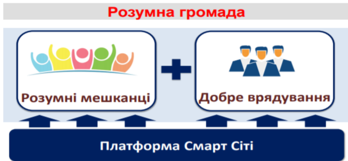
Рис. 2. Інформаційна платформа Смарт Сіті

самоврядування м. Дрогобича для посилення зв'язків з громадськістю показала, що особливо актуальною стала інформаційна платформа Смарт-Сіті. (рис. 2.)