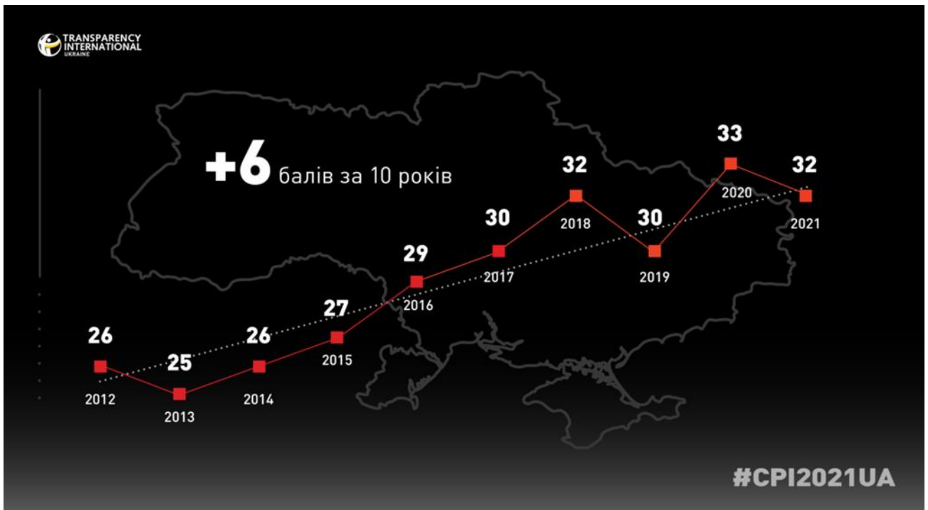
Рис. 2.2. Динаміка змін рейтингу України за індексом сприйняття корупції (Corruption Perceptions Index – CPI) за 2012 – 2021 роки