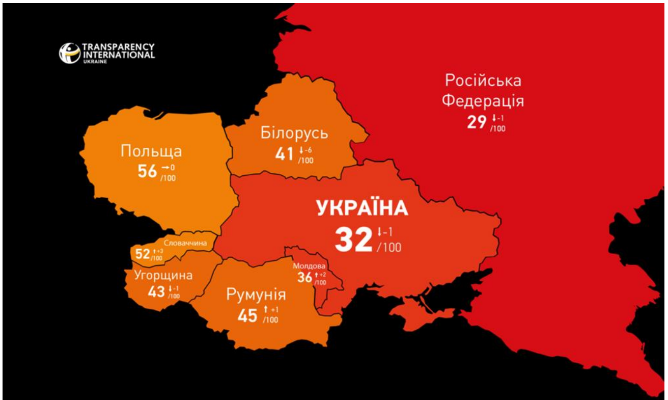
Рис. 2.1. Бали України в Індексі сприйняття корупції (Corruption Perceptions Index – CPI) станом на січень 2022 року