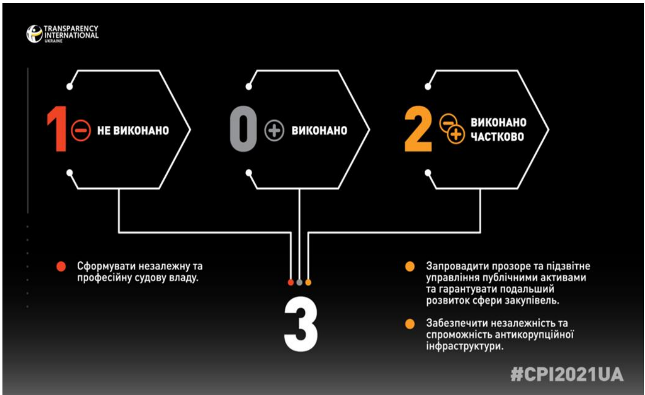
Рис. 3.1. Рекомендації Трансперенсі Інтернешнл Україна за результатами 2021 року