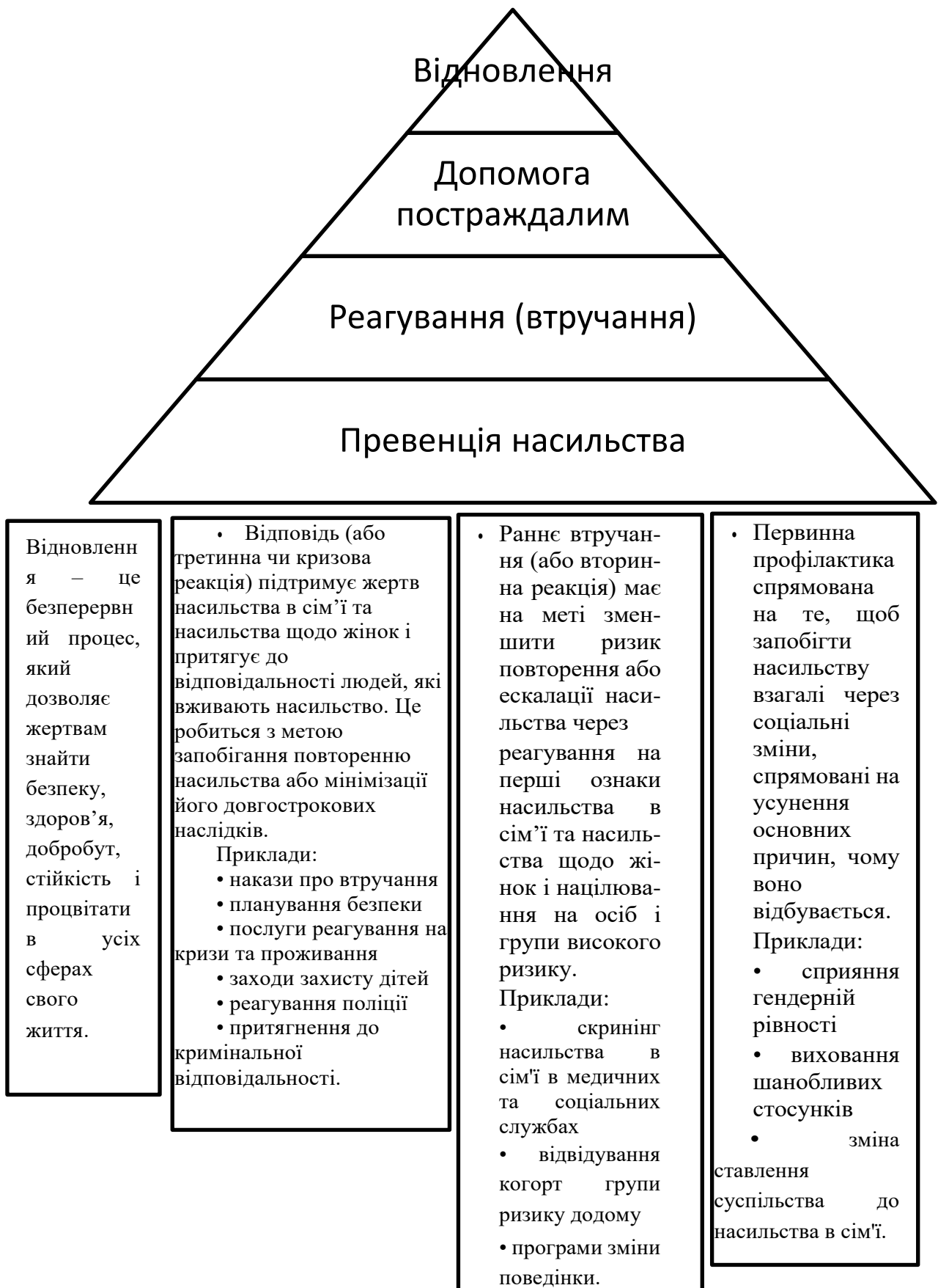
Рис. 3.1. Рівні дій для більш здорового та безпечного суспільства