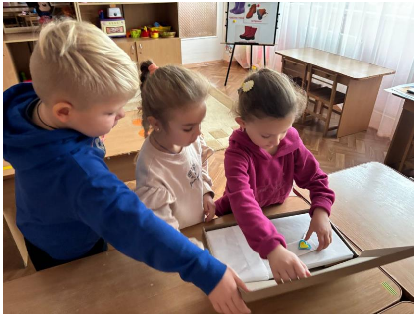
Рис. 2.2 Групові приміщення (група № 9) КЗДО № 400 ДМР

Кожна група дітей має окрему кімнату, обладнану столами, стільцями та іграшками, розділену на функціональні зони для навчання, ігор та сну. Групова кімната включає: роздягальню, групову кімнату, спальню, санвузол. Кожен санвузол має: дитячі унітази з перегородками, раковини та піддони для миття. У груповому приміщенні створені необхідні умови для якісної організації життєдіяльності дітей. Також групова кімната обладнана з урахуванням потреб дітей, що дозволяє їм комфортно та активно розвиватися. Предметно-ігрове середовище динамічне та різноманітне, дозволяє дітям самостійно обирати та змінювати види діяльності, розвиваючи при цьому творчі здібності та уяву. Це: книжковий куточок, інтелект-центр, конструкторські, сюжетно-рольові ігри, ігри-пізнання природи, в яких зібрані малюнки, дидактичні ігри, іграшки-розповіді, дитяча література тощо. Групи забезпечені ілюстративними матеріалами, сучасними методиками навчання та розвитку, програмними методиками, які дозволяють реалізувати завдання Базового компонента дошкільної освіти (Державного стандарту дошкільної освіти) та чинних програм. Ігрове обладнання відповідає віковим особливостям дітей раннього та дошкільного віку.