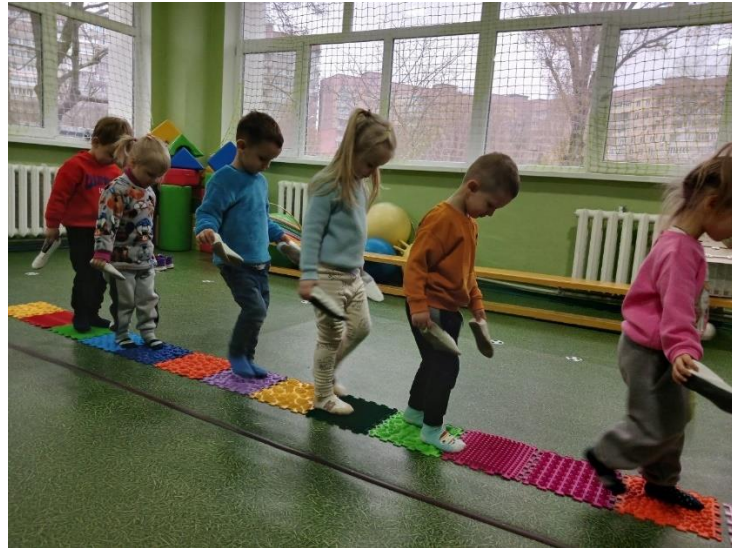
Рис. 2.9. Заняття з фізичної культури КЗДО № 400 ДМР

Не забезпечується у повній мірі корекційна спрямованість освітнього процесу для дітей з ООП.