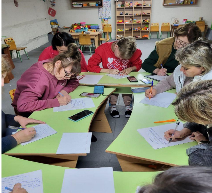
Рис. 2.10. Педагоги закладу взяли участь у написанні Всеукраїнського диктанту національної єдності

Недостатньо відпрацьована технологія оцінювання рівнів розвитку дітей з ООП; відсутні чіткі роз'яснення із даної проблеми