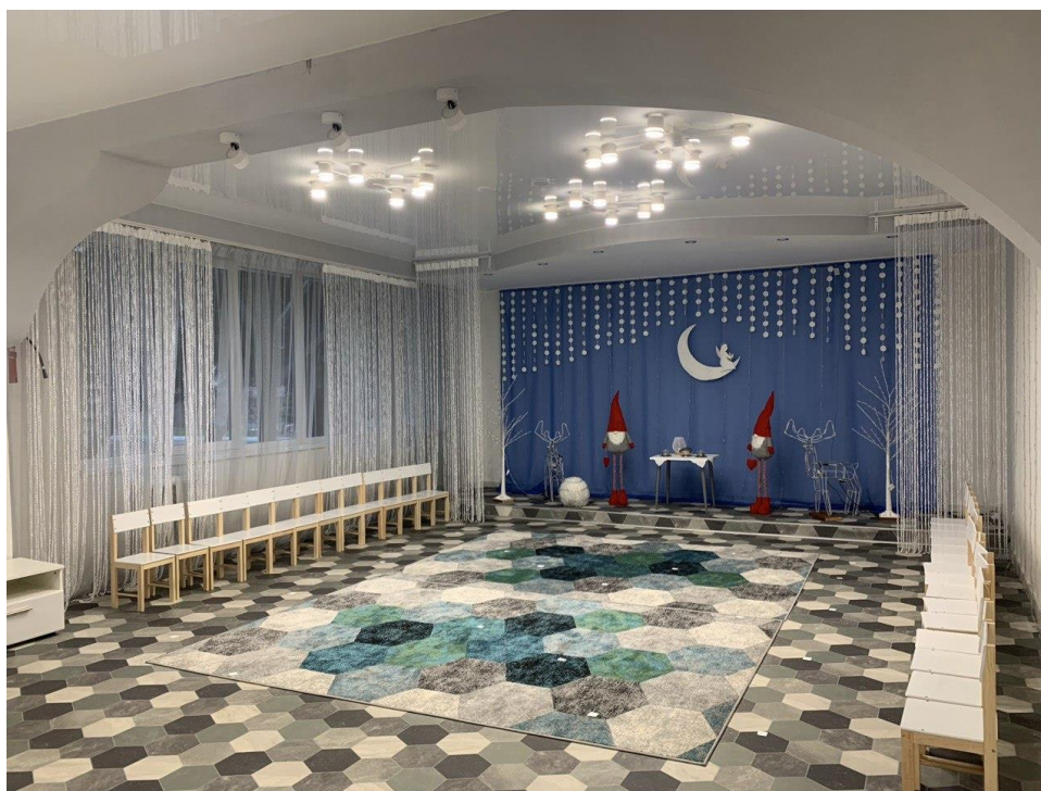
Рис. 2.4. Музична зала КЗДО № 400 ДМР