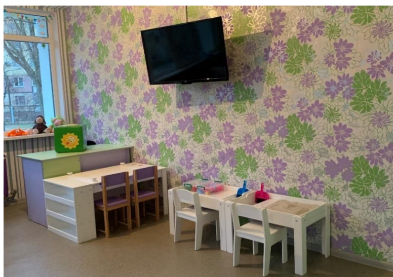
Рис. 2.6. Кімната практичного психолога КЗДО № 400 ДМР