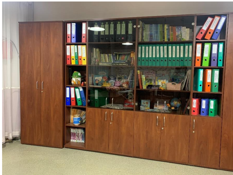
Рис. 2.7 Методичний кабінет КЗДО № 400 ДМР

У КЗДО як програмно-методичне забезпечення навчально-виховного процесу використовуються навчальні видання, рекомендовані Міністерством освіти і науки України для використання в дошкільних навчальних закладах протягом навчального року, розміщені на сайті МОН України. Про що сказано в щорічних міністерських листах МОН про перелік матеріалів і навчальних програм, рекомендованих для використання МОН України в навчально-виховному процесі закладів дошкільної освіти протягом навчального року.