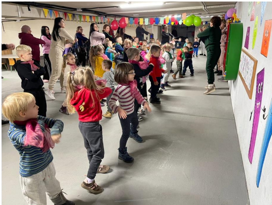
Рис. 2.8 Тимчасове укриття КЗДО № 400 ДМР

Стратегічний аналіз Програми розвитку призначений для фіксації та демонстрації успіхів і проблем освітнього процесу, які будуть розглянуті в розділах/блоках Програми розвитку відповідно до аналізу. SWOT-аналіз діяльності КЗДО № 400 ДМР формується за основними напрямками з урахуванням його потенційних внутрішніх переваг і недоліків.