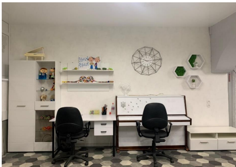
Рис. 2.5. Музична зала КЗДО № 400 ДМР