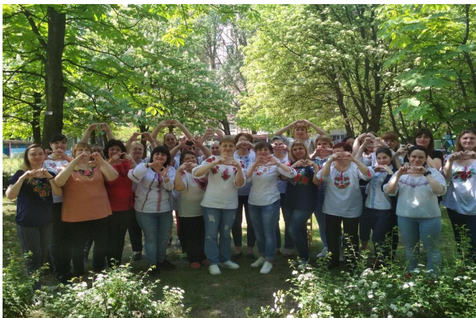
Рис. 2.11 Колектив КЗДО № 400 ДМР