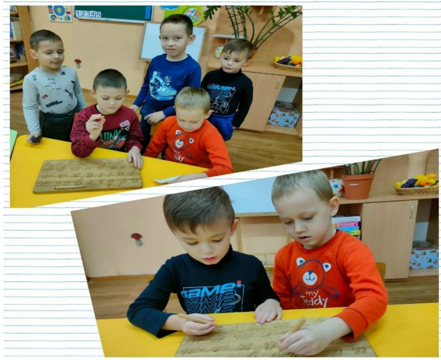
Рис. 2.2. Групові приміщення (група №8) КЗДО № 400 ДМР

Комунальний заклад дошкільної освіти (ясла-садок) № 400 Дніпровської міської ради двоповерховий. У закладі працює 9 вікових груп: 1 група для дітей раннього віку та 8 груп для дітей дошкільного віку.