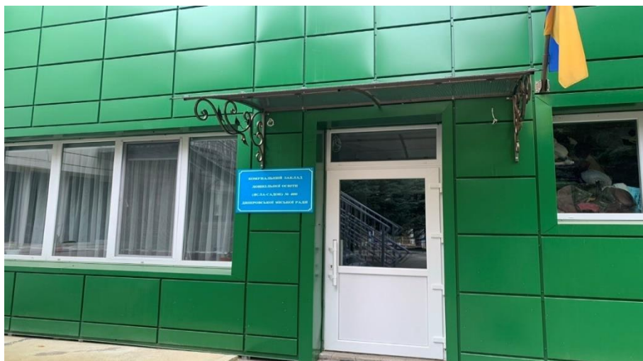
Рис. 2.1 Центральний вхід КЗДО № 400 ДМР

Комунальний дошкільний навчальний заклад (ясла-садок) № 400 Дніпровської міської ради (далі – КЗДО № 400 ДМР) загального типу здійснює свою діяльність відповідно до: Конституції України [39]; Закону України «Про дошкільну освіту» [18], «Про освіту» [20]; Національна доктрина розвитку освіти [18]; Конвенція «Про права дитини» [40]; Закон України «Про охорону дитинства» [21]; Санітарний регламент закладів дошкільної освіти [22]; Статут; Положення про дошкільний навчальний заклад; Колективний договір між адміністрацією, профспілковим комітетом і трудовим колективом; Правила внутрішнього трудового розпорядку; посадові та робочі інструкції; Норми харчування за системою НАССР для дошкільних навчальних закладів; Положення «Про порядок здійснення інноваційної діяльності»; оновленого Базового компонента дошкільної освіти та інших документів відповідно до норм чинного законодавства.