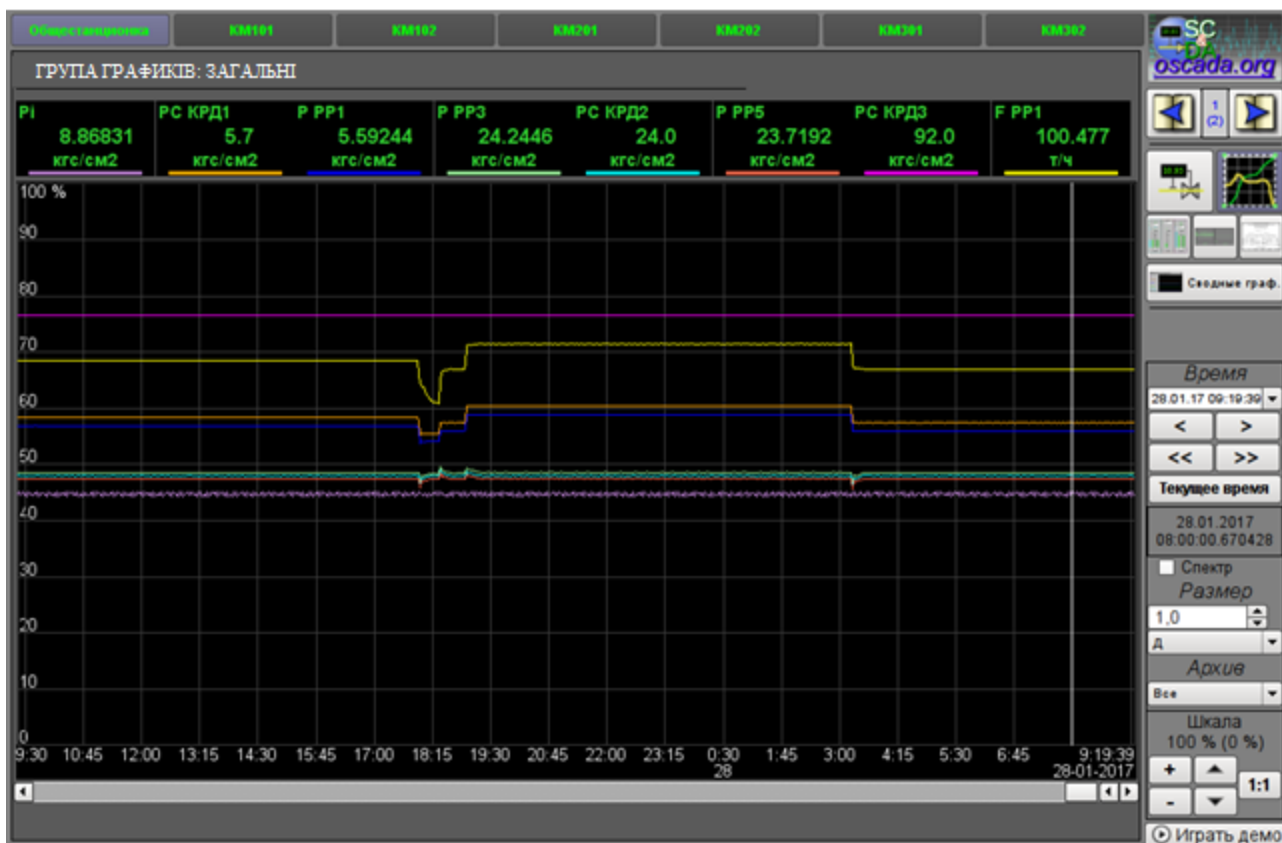
Рис. 5. Моніторинг технічного стану дегазаційного газопроводу в реальному часі в програмному комплексі «ДІА»