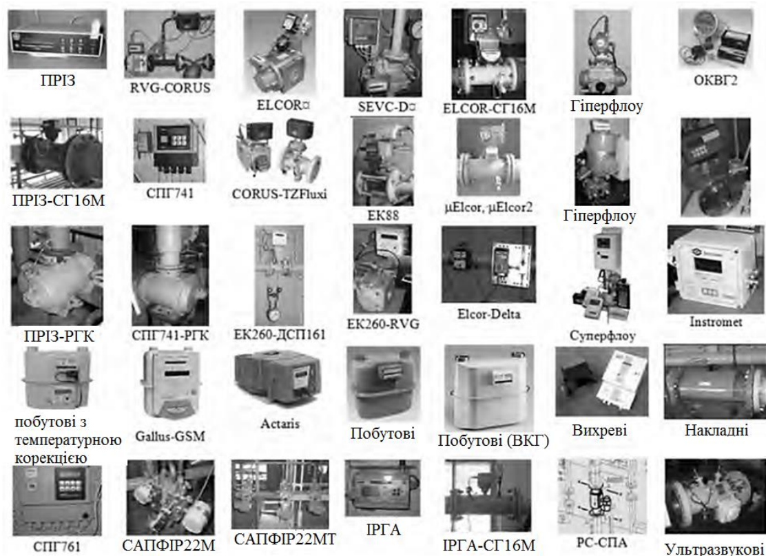
Рис. 1. Промислові комплекси для реєстрації газу метану

Аналіз сучасних досліджень і публікацій. Порівняльний аналіз класифікаційних показників існуючих вимірювальних комплексів об'ємної витрати метану показав, що на даний момент у гірничій галузі відсутні технічні, методичні та нормативно-правові документи щодо вирішення означених проблем [1–3]. В нафтогазовій промисловості відмічають велику кількість вимірювальних комплексів обліку метану та природного газу (рис. 1), однак застосування їх у складних гірничо-геологічних умовах виявляється не можливим.