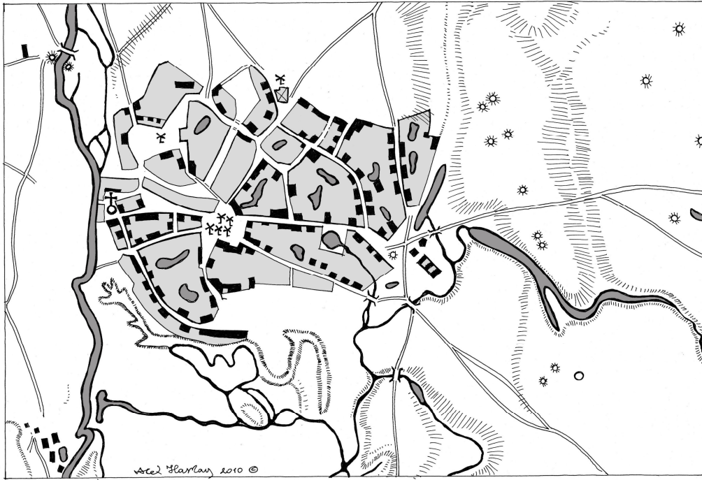
Мал.1. Село Бабайківка Новомосковського повіту Катеринославської губернії. Прорис автора за картографією XIX ст.