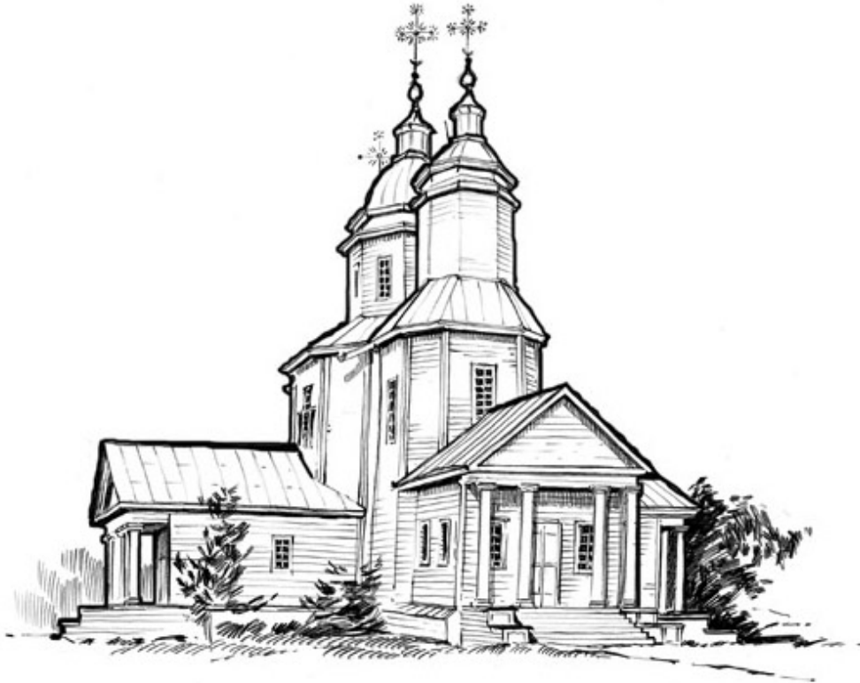
Мал.2. Свято-Миколаївська церква у с. Бабайківка. Зовнішній вигляд храму. Прорис К.Сидорова за фото 1930-х рр.

вінчалися двозаломними верхами зі світловими восьмикутниками й глухими ліхтарями. У першій половині XIX – наприкінці XIX ст. церква зазнала ремонтів і добудов: первісну форму бань замінено на сферичну, восьмикутник над бабинцем зі світлого перетворено на глухий, вертикальне зовнішнє шалювання стін замінено горизонтальним, а перед входами до храму з трьох боків прибудовано невисокі, прямокутні в плані, притвори з чотириколонними ганками і трикутними фронтонами на фасадах [23].