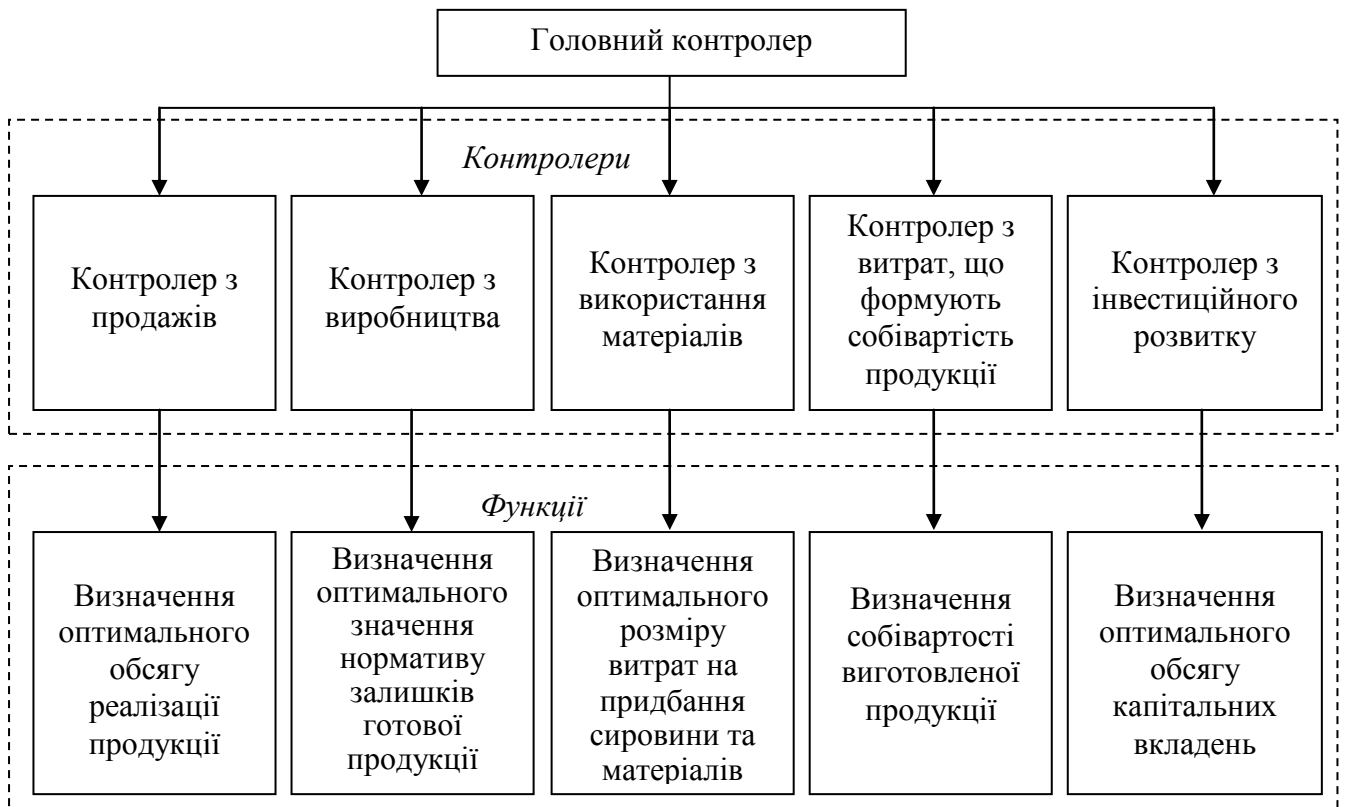
Рис. 3. Рекомендована функціональна структура контролінгу промислового підприємства