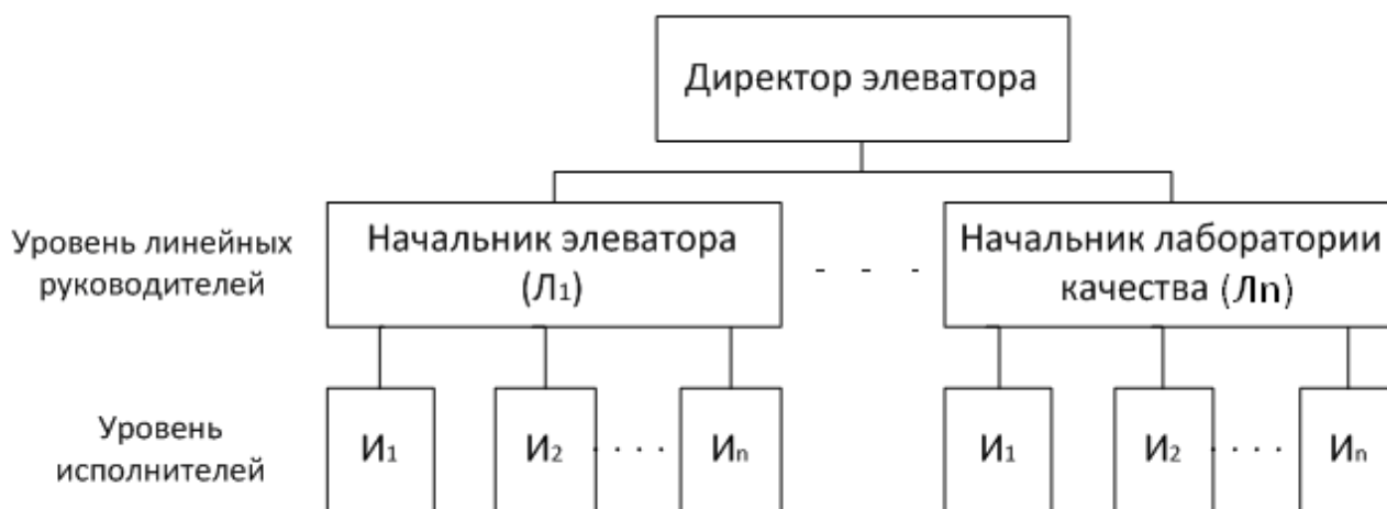
Рис. 1. Линейная структура управления элеватором

Преимущества линейной структуры: простота применения, четкое распределение обязанностей и ответственности, благоприятные условия для принятия оперативных решений и поддержания дисциплины.