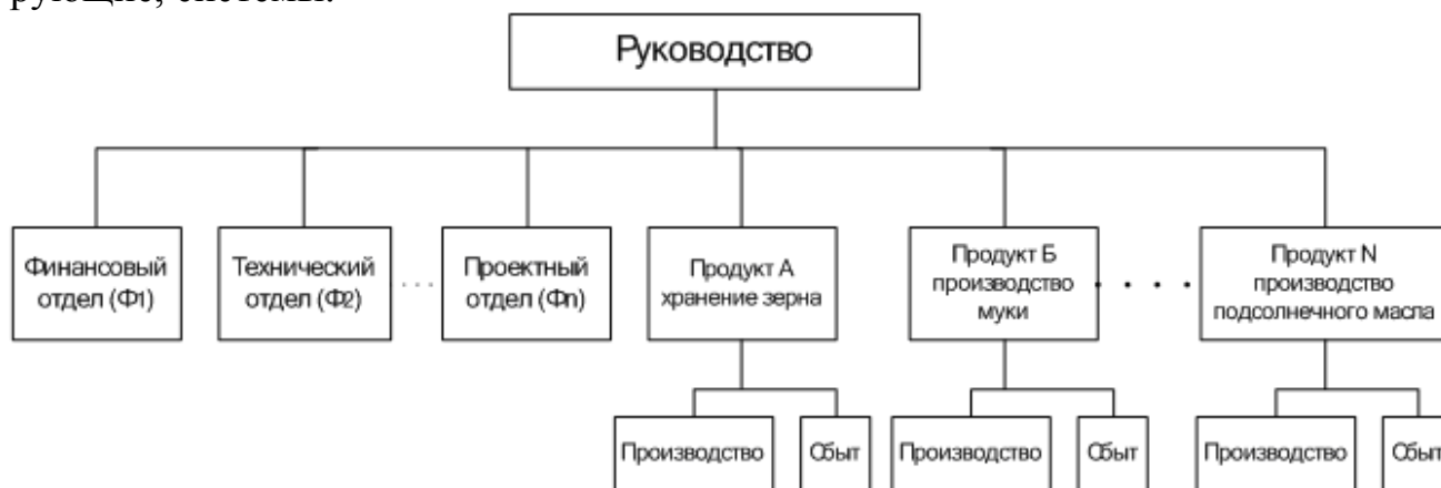
Рис. 3. Дивизиональная (продуктовая) структура управления крупной компанией

ще всего уже функционирует в локальных АСУ. Задача состоит в выделении и предоставлении необходимой проблемно ориентированной информации ЛПР с определением ее значимости и оценкой. Рассмотрим типовые, уже функционирующие, системы.