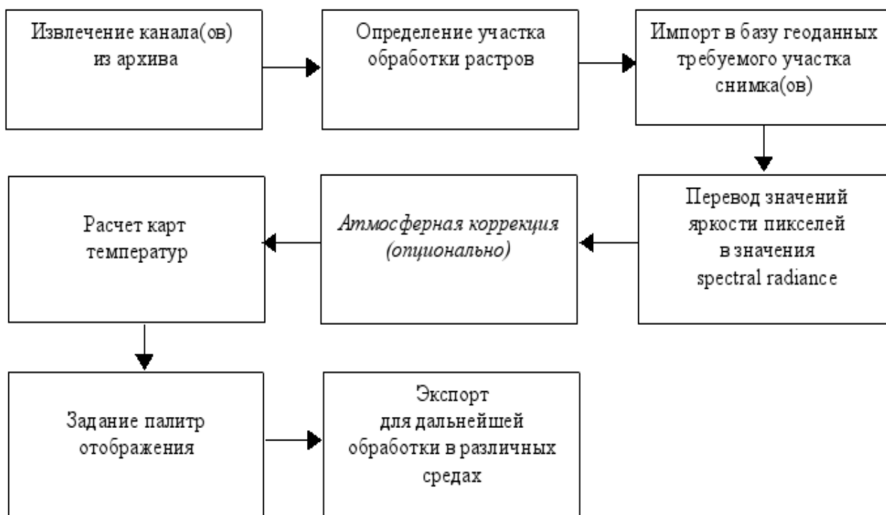
Рис. 2. Этапы процесса обработки космоснимков, автоматизированные в ГИС GRASS

Для обработки 9-ти мультиспектральных снимков использована технология автоматизированной обработки на основе предложенных командных скриптов для ГИС GRASS. Этапы процесса обработки, автоматизированные при помощи скриптов, представлены на рис. 2.