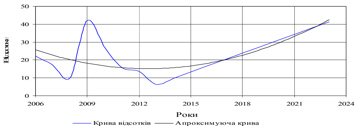
Рис.1. Динаміка змін відсотку обсягу спецфонду ЗСУ від загального обсягу фінансування ЗСУ за період 2006-2013 рр. з прогнозними показниками на період до 2023 р.

фінансування ЗСУ за період 2006-2013 рр., та прогноз на зміну даного відсотку на період до 2023 р. (рис. 1):