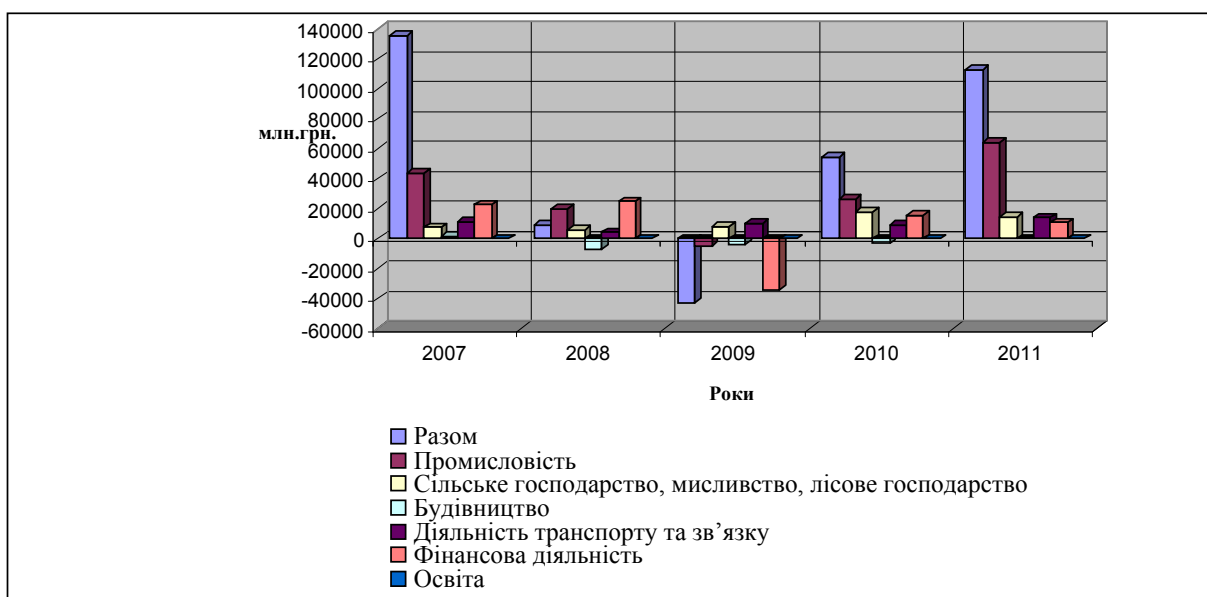
Рис 2. Динаміка фінансового результату діяльності за галузями економіки

Отже, в нинішній час спостерігається чітко виражена тенденція втрати підприємствами здатності виробництва складної і наукомісткої продукції, причому не тільки нової, але і тієї, що випускалася ними раніше в умовах стабільного розвитку економіки. Також при зміні частки збиткових підприємств змінюється і фінансовий результат за видами економічної діяльності. Згідно динаміки фінансового результату діяльності за галузями економіки протягом 2007-2011рр. ми можемо спостерігати беззбитковий розвиток галузей у 2007 році, падіння прибутку вже у 2008 році та найшвидший регрес у 2009р. (табл.2, рис.2). Як показують опрацьовані дані, негативні тенденції в національній економіці після кризи 2009 року перервані у 2010 році і ще більшого покращення зазнали у 2011 році. Хоча, для більш точної картини потрібно проаналізувати чинники таких змін, що і буде здійснено у наступних наших дослідженнях.