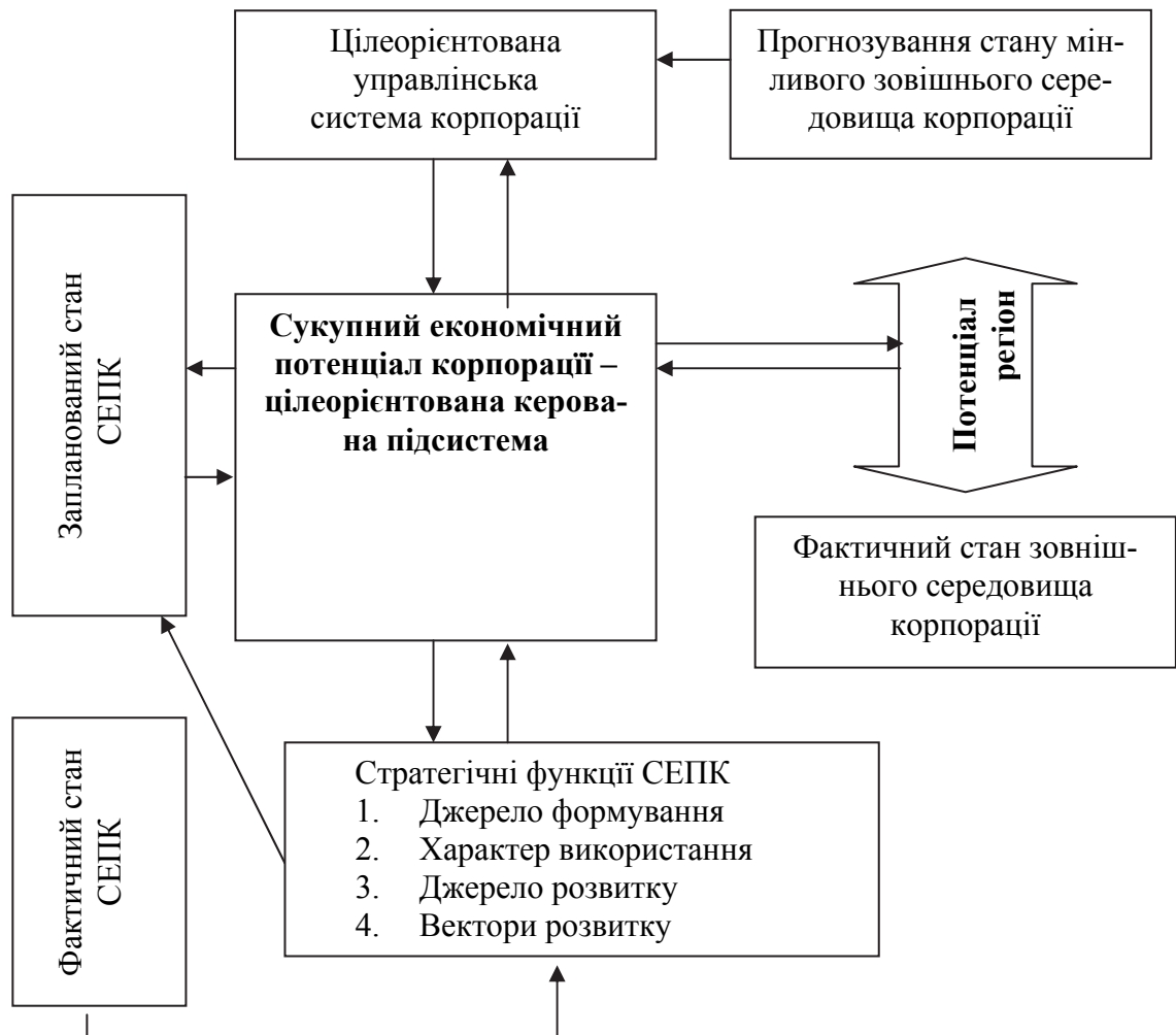
Рис. 3. Місце та роль сукупного економічного потенціалу в системі стратегічного управління корпорацією

чинників його внутрішнього й зовнішнього середовища є можливість виокремлення трьох основних груп суперечностей: між зовнішнім і внутрішнім середовищем; між короткостроковими й довгостроковими цілями функціонування корпорації; між цілями окремих учасників, у тому числі регіону, та цілями корпорації в цілому.