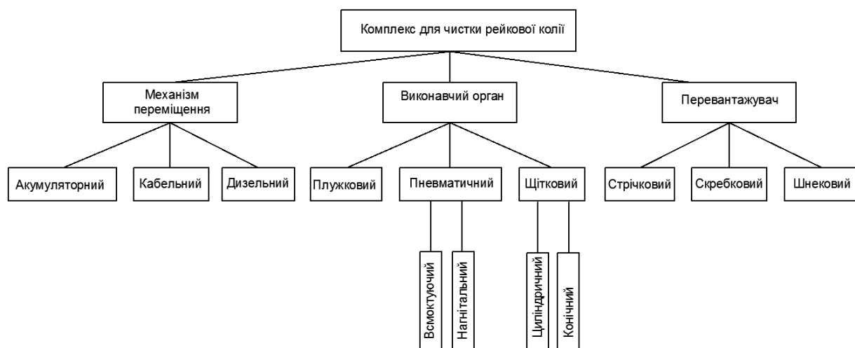
Рис.1. Класифікація елементів машин для очищення рейкових шляхів

Очищення стисненим повітрям вимагає, по-перше наявності останнього, тобто компресора, по-друге призводить до розльоту шматків гірської маси у простір виробки, що небезпечно для персоналу. Щітка зі сталевого дроту в якості виконавчого органу позбавлена наведених недоліків, оскільки в разі зустрічі з жорсткою перешкодою не відбувається удару і динамічні навантаження компенсуються пружністю дротів. Що стосується вибору виду механізму перевантаження гірничої маси від виконавчого органу в вагонетки, необхідно керуватися фізико-механічними властивостями вантажу, перш за все його вологістю: часто породи, що розмокають неможливо транспортувати стрічковим перевантажувачем. У цих умовах необхідно застосовувати скребокковий конвеєр або шнек.