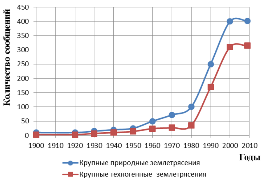
Рис. 1. Сообщение о крупных природных (1) и техногенных (2) землетрясениях

скоростей продольных и поперечных волн перед землетрясением сначала уменьшается, а затем быстро возрастает. Эту закономерность используют в качестве прогнозного параметра. Однако, несмотря на многочисленные исследования причины возникновения землетрясений полностью не изучены.