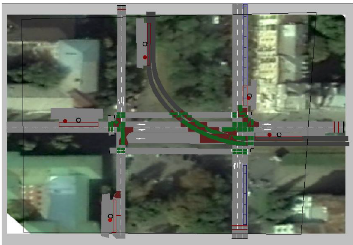
Рисунок 4 – Модель перекрестка после введения конфликтных зон

ставляют собой элемент связи для влияния на конфликты между транспортными средствами на двух отрезках. С их помощью устанавливается приоритет проезда на перекрёстке. Было установлено, что в данном узле существует 55 конфликтных зон. Затем, согласно Правилам дорожного движения, было определено, какой отрезок в каждом из пересечений является приоритетным. Такой отрезок выделен зелёным цветом. Отрезок красного цвета – уступающий. Возможен ещё один вариант – оба отрезка красного цвета. Такой метод проезда конфликтной зоны используется для моделирования движения на разветвлениях, чтобы транспортные средства могли «видеть» друг друга. После введения конфликтных зон перекрёсток приобретает вид, представленный на рисунке 4.