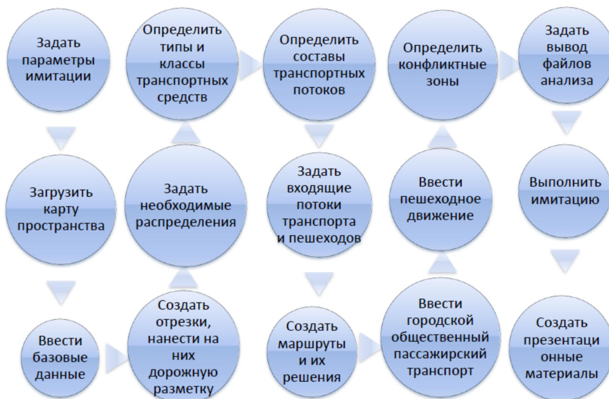
Рисунок 1 – Алгоритм создания модели перекрестка

Для создания и последующего анализа модели выбранного перекрёстка был разработан алгоритм, который также может быть использован для построения других сетей в VISSIM (рисунок 1).