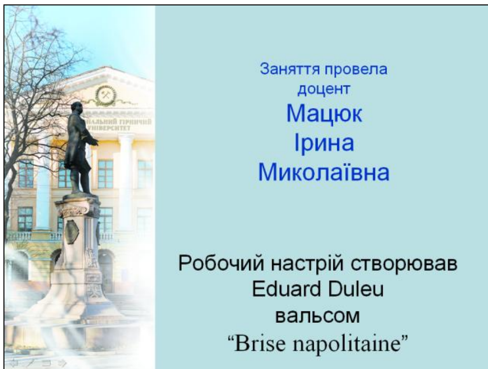
Рисунок 4 – Один из финальных кадров фильма «Построение планов скоростей»