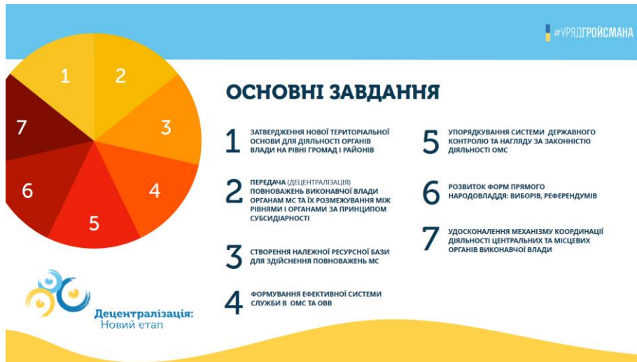
Рис. 1.2 Основні завдання другого етапу децентралізації публічної влади

Наступним кроком у розвитку законодавчої бази має бути внесення зміни до Конституції щодо децентралізації, які необхідні для подальшого просування реформи та її завершення.