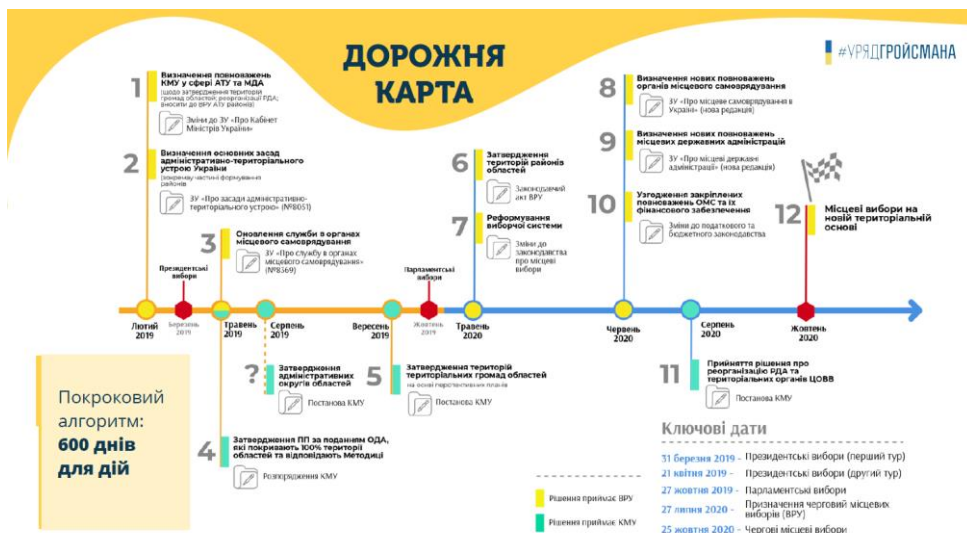
Рис. 1.3 Дорожня карта подальшої децентралізації публічної влади

У результаті чергової місцевої вибори восени 2020 року мають пройти на новій територіальній основі районів та громад. Повноваження між рівнями управління повинні бути розмежовані за принципом субсидіарності. Мешканці громад мають бути забезпечені механізмами та інструментами впливу на місцеву владу та участі у прийнятті рішень.