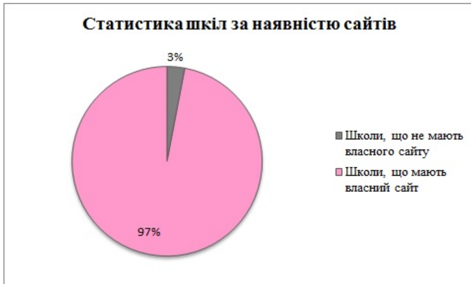
Рис. 2. – Статистика шкіл за наявністю сайтів.