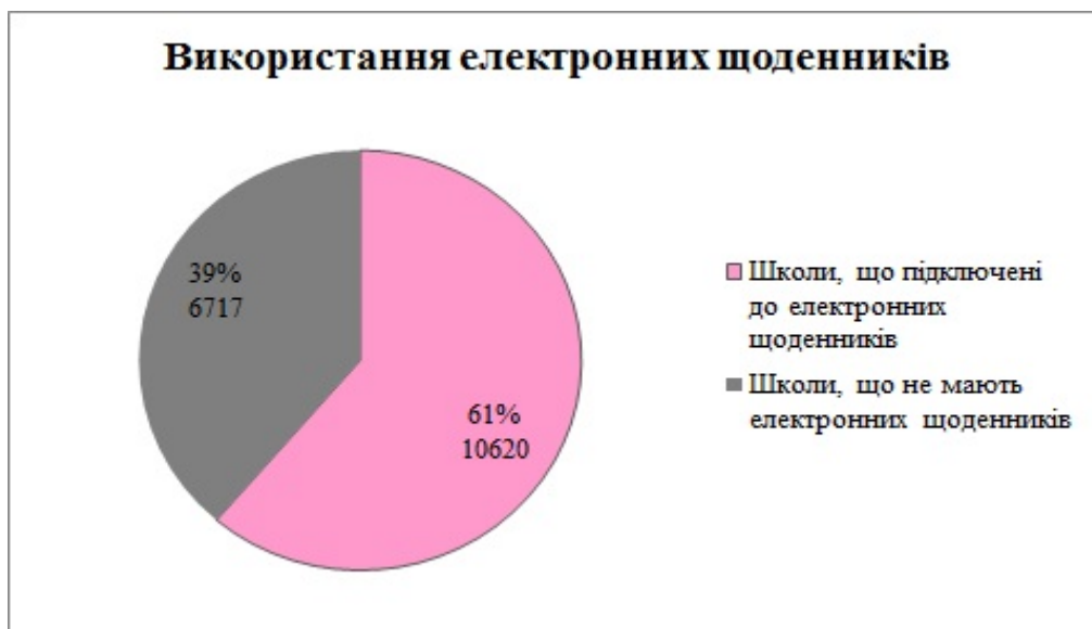
Рис. 3. – Використання електронних щоденників.

Проводиться багато медіа-конкурсів серед учнів. Так у Дніпропетровської області за 2010-2015рр. було проведено 12 обласних Конкурсів серед шкіл області, в яких прийняло участь 65 шкіл, 348 учнів [8]. Активізовано роботи шкільних медіа освітніх студій та позашкільних закладів медіа освіти різного профілю.