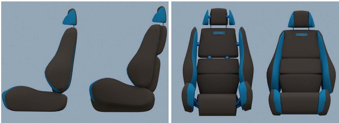
Рисунок 2 – Основные изображения проектируемого изделия