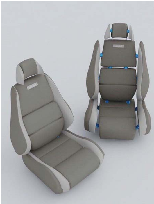
Рисунок 1 – Проектное решение автомобильного кресла

Основная идея проекта заключается в том, потенциальные потребители современного авторынка машин среднего класса, обладающих достаточной мощностью и относительно высокими скоростными характеристиками, должны обладать возможностью частичного тюнинга интерьера изделия (например, замены штатных автомобильных сидений на спортивные). Не хотелось бы, чтобы эти изменения привнесли диссонанс в эстетически продуманный дизайн и привели к нарушению целостности внешнего вида салона. Предлагаемый проект предусматривает разработку универсального кресла, выполненного в «спортивном» стиле, которое можно без потерь эстетических свойств целого вписать практически в любой салон рассматриваемого класса автомобилей.