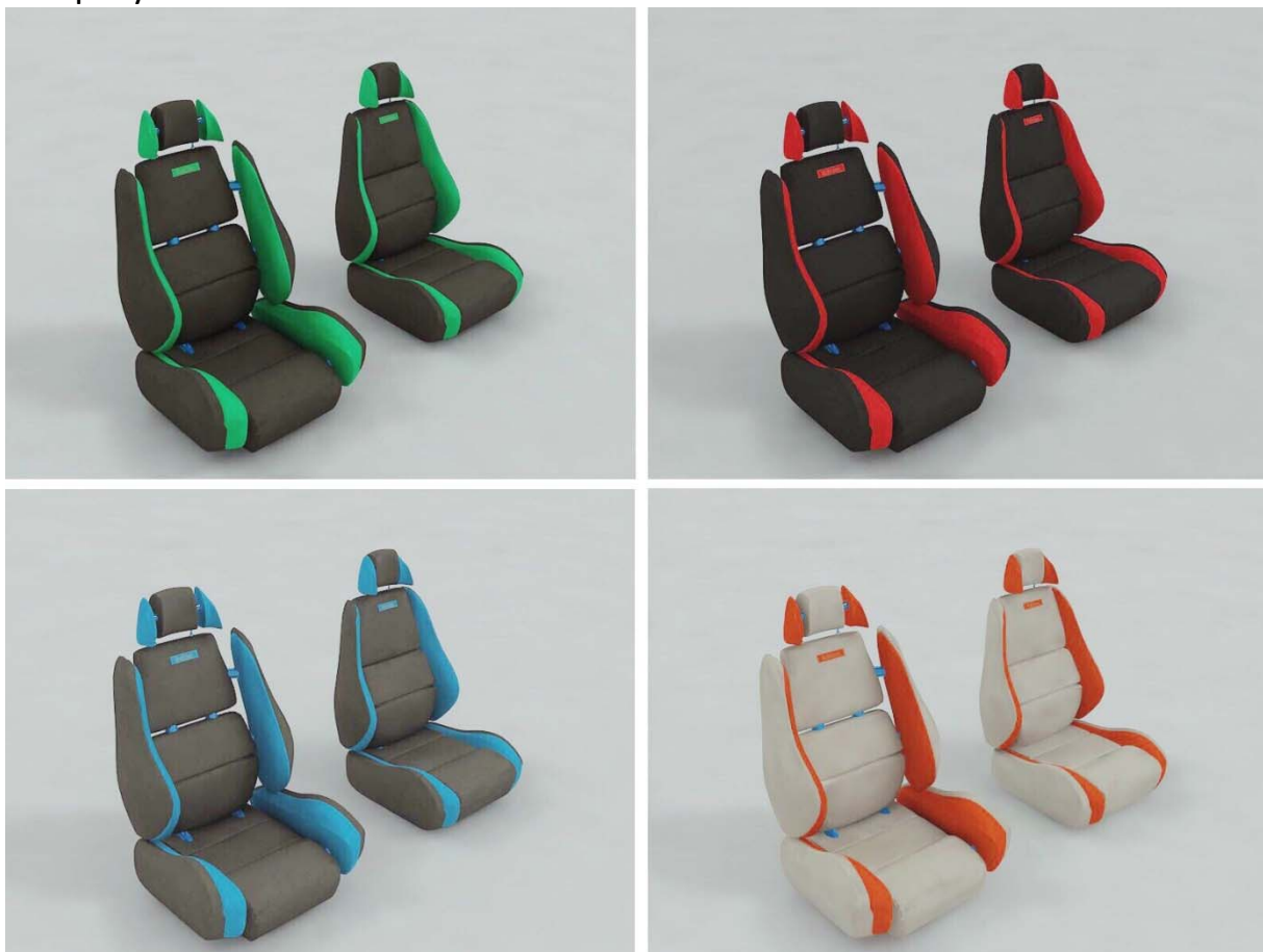
Рисунок 4 – Варианты предлагаемых цветовых решений

потребностям человека и достичь приемлемых с эргономической точки зрения результатов.