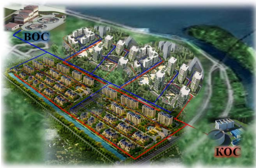
Рисунок 1 – Схема совместного водоснабжения и водоотведения центральной части г. Днепропетровска

Оборотная схема обладает еще большими возможностями в удешевлении системы водоснабжения. Это достигается сокращением потребления свежей воды и сброса загрязненных стоков.