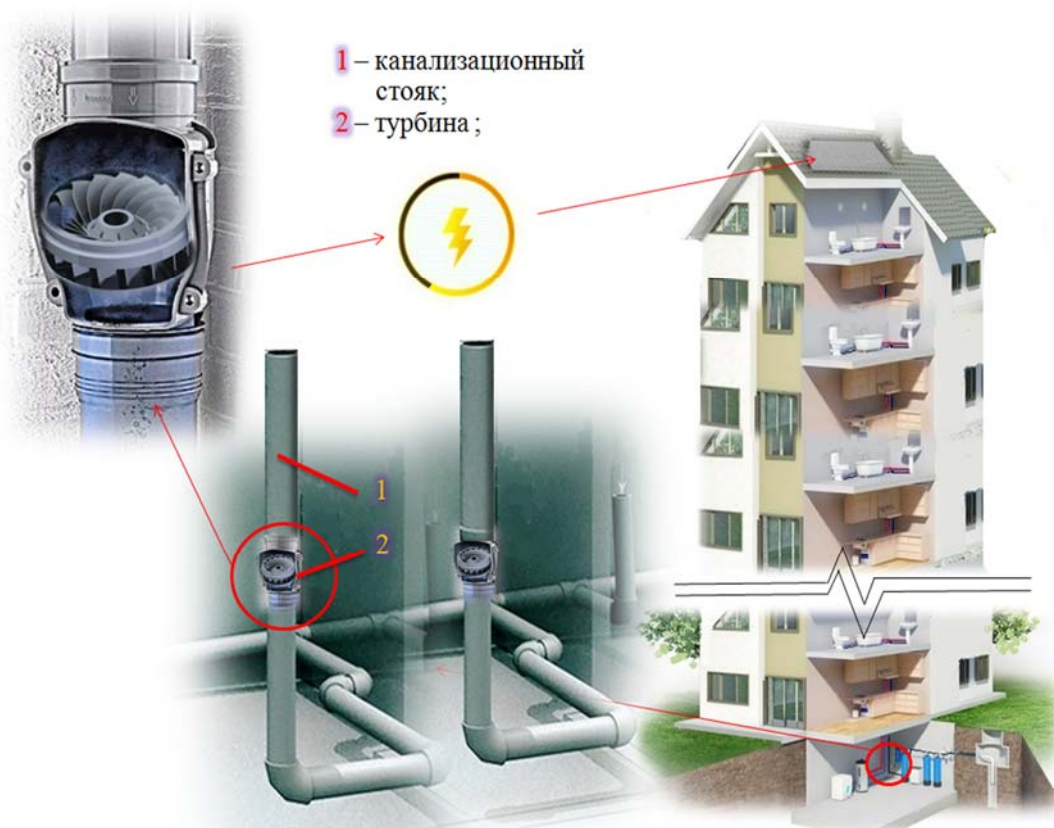
Рисунок 4 – Устройство двухтрубной системы водоотведения

Так как системы сброса будут иметь значительную высоту, то вода, которая будет сбрасываться с верхних этажей можно использовать для преоб-