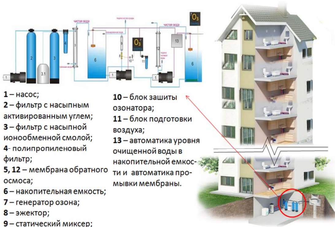
Рисунок 2 – Расположение обратноосмотической установки в жилом доме

Для систем горячего водоснабжения предлагается использовать солнечные батареи, которые будут интегрированы в обычную черепицу крышных покрытий. Инфракрасное солнечное излучение нагревает теплоноситель или обычную воду в солнечном коллекторе, после чего нагретая вода аккумулируется в баке-накопителе, и может использоваться для бытовых нужд или для обогрева здания.