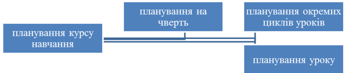
Рис. 2.2 Система планування навчального процесу [27, 94]

Також, студентам надається завдання скласти схему системи планування навчального процесу.