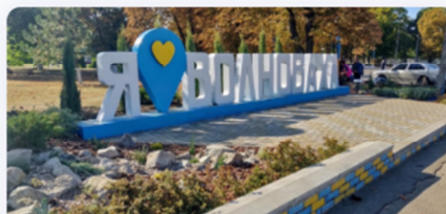
Рисунок 2 – Налаштування на місто

При правильному управлінні проектом, тобто своєчасному надходженні фінансових ресурсів, постійного оновлення та удосконалення функціоналу, оригінальної рекламної кампанії та впровадження ряду партнерських програм для бізнесу, даний проект може стати невід'ємною частиною міського життя, дати громаді інструмент впливу на постачальників адміністративних та інших послуг.