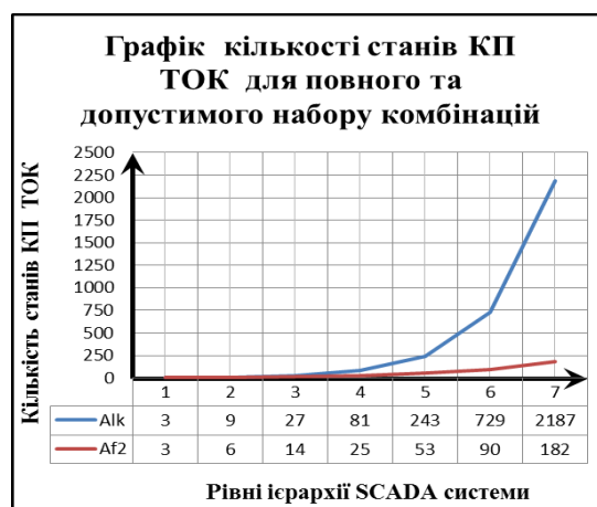
Рис. 2.2. Графіки динаміки зміни кількості станів КП ТОК

На всі наведені рисунки в тексті роботи повинні бути посилання або в дужках (рис. 2.1), або по контексту, наприклад, «... як показано на рис. 2.2)». Допускається вертикальне розміщення рисунків за годинниковою стрілкою.